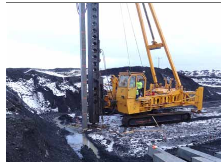
Byrjað á nýrri brú yfir Múlakvísl. Staurar reknir niður, 23.01.2013.

Framkvæmdadeild Vegagerðarinnar hafði umsjón með framkvæmdinni og eftirlit á staðnum var framkvæmt af tæknideild á Suðursvæði. ■