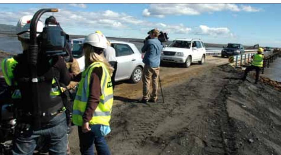
Múlakvísl 16. júlí 2011. Fjölmíðlafólk fylgist með opnun bráðabirgðabráur.

mannvirki sem gæti staðist atburð af þeirri stærðargráðu. Einnig voru gerð hermílkön fyrir mun stærra flóð til að átta sig á afleiðingum slíkra atburða. Talsvert magn af grjóti þurfti í varnargarð vegna framkvæmdarinnar og var nokkur vinna lögð í leit að því en grjótnámur með heppilegu bergi eru af skornum skammti á þessu svæði.