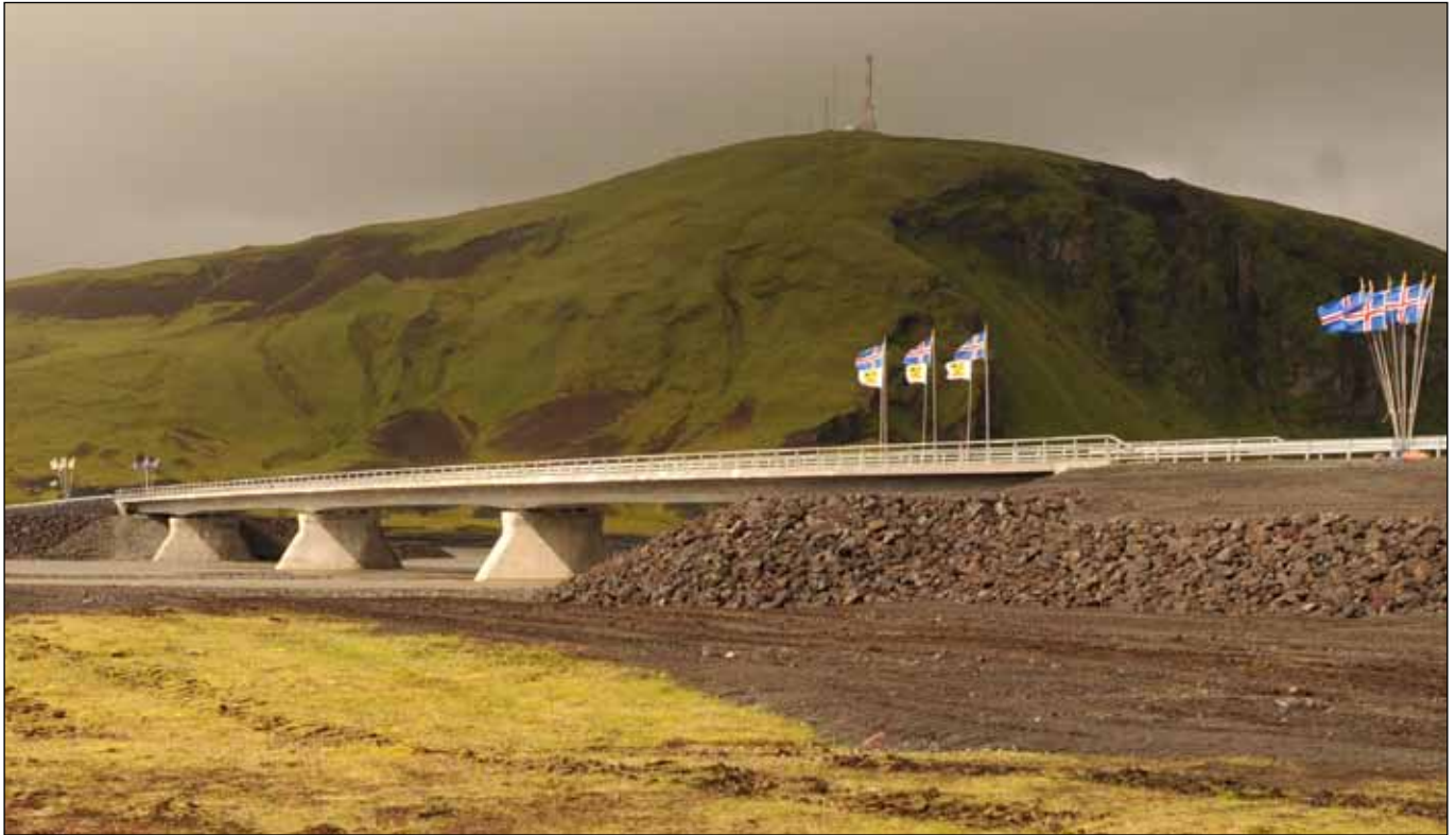
Brú yfir Múlakvísl á vígsludegi 6. ágúst 2014.