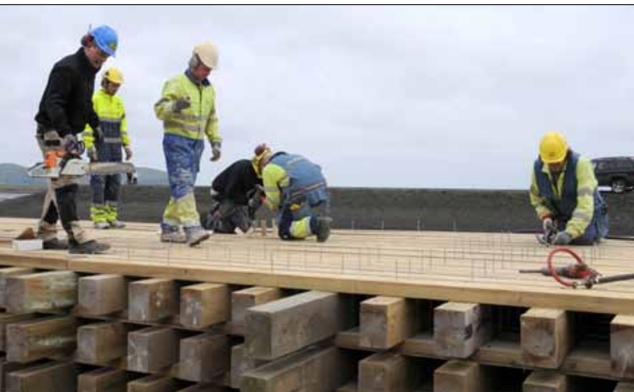
Gerð bráðabirgðabráur á Múlakvísl 12. júlí 2011. Brúardekkið var smíðað í einingum á landi og þær síðan hífðar á stálbitana.

Fljótlega var hafinn undirbúningur að nýrri brú og var talsverð vinna lögð í rannsóknir vegna þess. Meðal annars var gerð flóðaherminn fyrir samskonar atburð og varð þess valdandi að fyrri brú fór af og markmiðið var að hanna