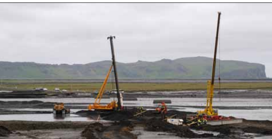
Múlakvísl 12. júlí 2011. Til vinstri á myndinni er hamarinn sem rak niður staura fyrir undirstöður. Til hægri er krani brúarvinnuflokkanna.