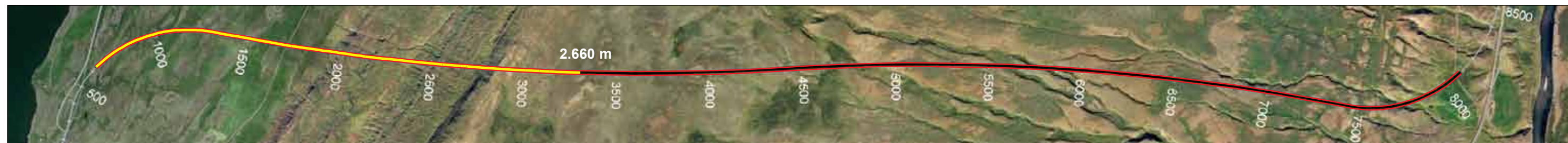
Vaðlaheiðargöng, staða framkvæmda 11. ágúst 2014. Búið er að sprengja 2.660 m frá Eyjafirði sem er 36,9% af heildarlengd.

Hringveginn aftur, var fyrst áætlað að verkið tæki tvær til þrjár vikur en fljótlega þegar heildarmyndin fór svo að skýrast glæddust vonir um að hægt yrði að flýta verkinu. Fór svo að ►