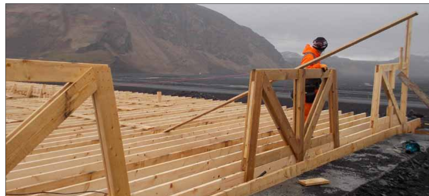
Uppsláttur undir brúardekk, 03.04.2014.