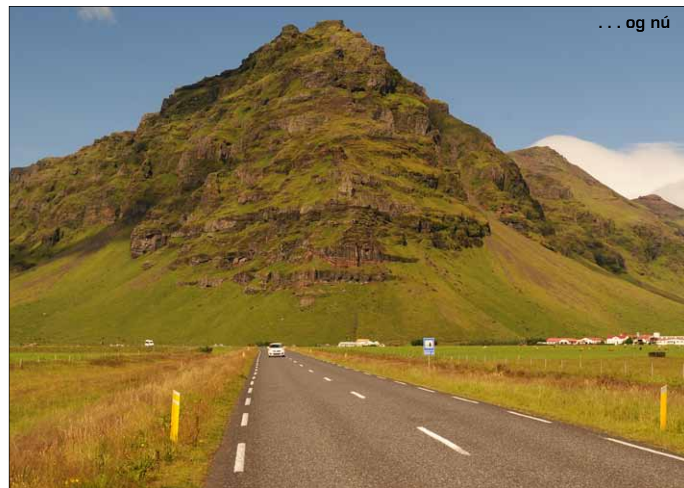
Hringvegur (1) við Þorvaldseyri undir Eyjafjöllum. Eldri myndin er úr safni Jóns J. Víðis, ódagsett.