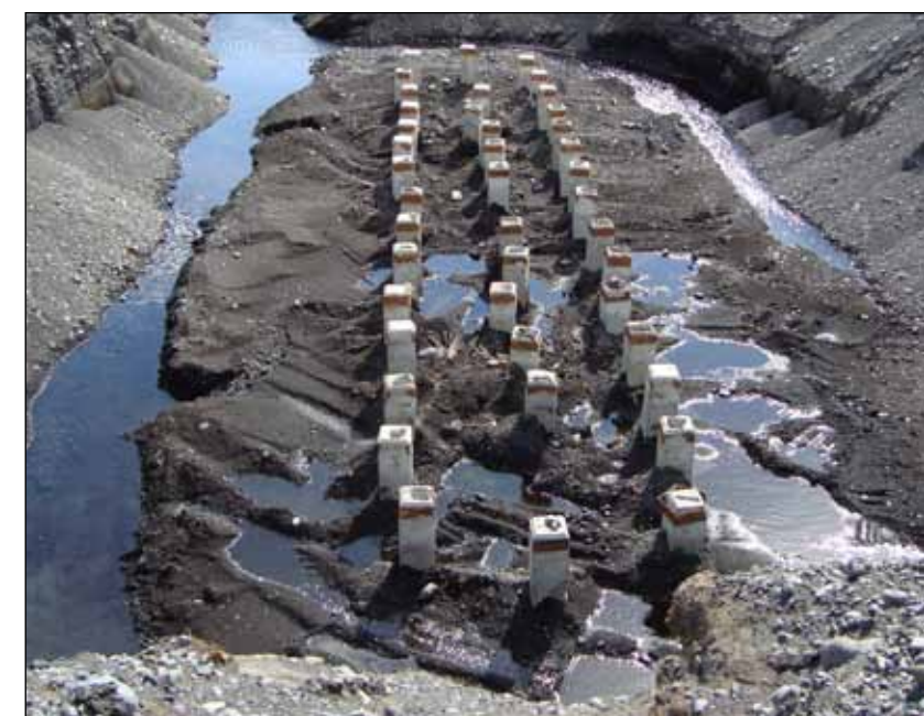
Staurar tilbúnir fyrir sökkul, 05.08.2013.