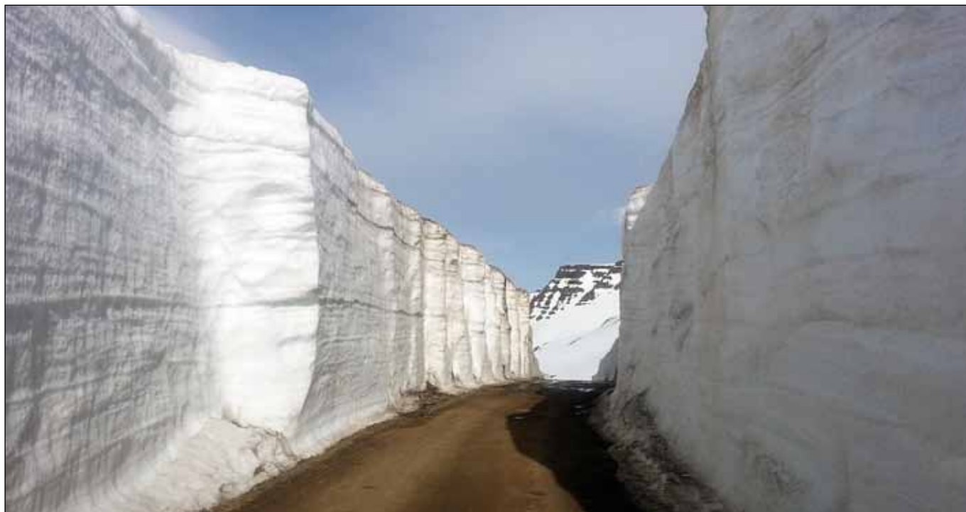
Mjóaffjarðarvegur (953) mánudaginn 3. júní 2013.