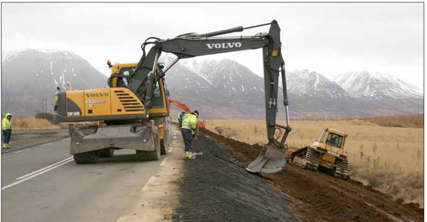
Hringvegur (1) á Moldhaugahálsi norðan Akureyrar. Efri myndin sýnir hættulega brattan vegfláa en neðri myndin framkvæmdir þegar efni var bætt við vegfláann til að minnka hallann.

Skurðir og árfarvegir skulu ekki vera innan öryggissvæðisins. Ef sú er hins vegar raunin, skal skrá staðsetningu þeirra og ►