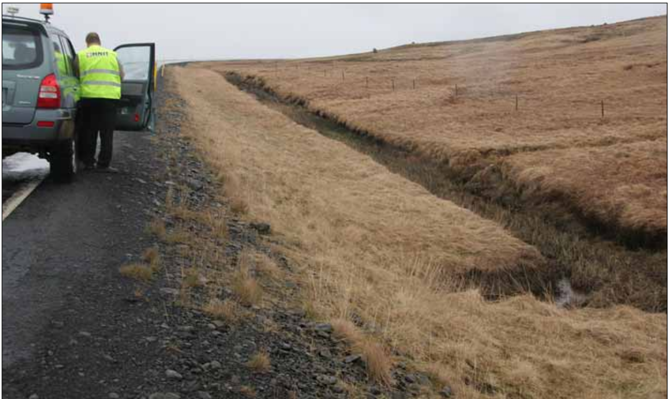
Djúpir skurðir meðfram vegum eru mjög hættulegir vegfarendum. Þar sem ræktun er aflögð er eðlilegast að fylla upp í þessa skurði með því að fletja bakka þeirra ofan í þá.