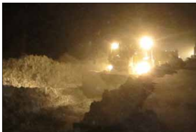
Snjómokstur á Vestfjarðavegi (60) í Kjálkafirði 30. desember. Sjá einnig forsíðu. Myndin til hægri er frá sama verkefni og er birt hér til að minna á að birtu nýtur ekki við í margar klukkustundir á degi hverjum í desember svo snjómokstur er mestan part unninn í svarta myrkri.