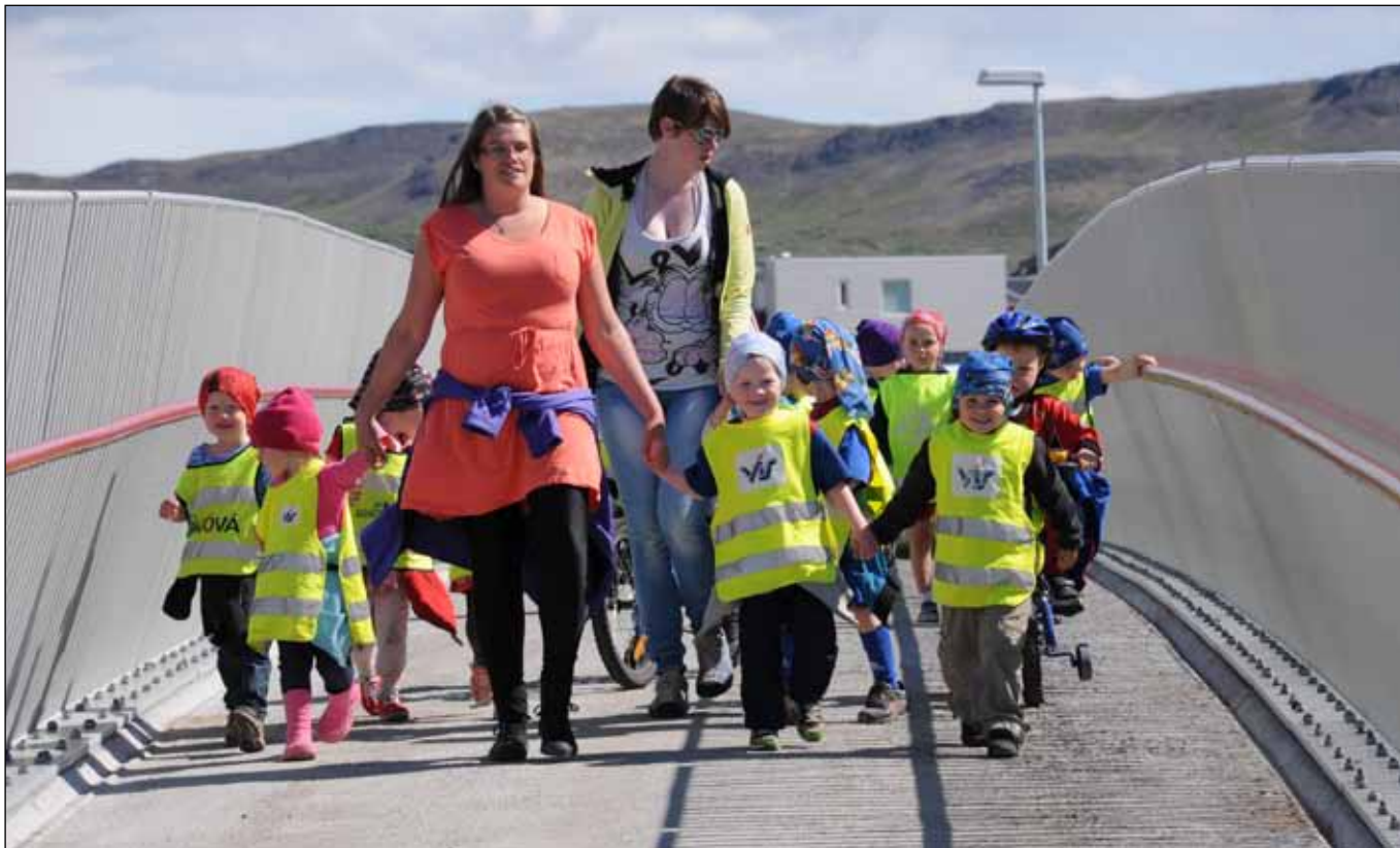
Börn úr Krikaskóla mættu í vígslu göngubrúar í Mosfellsbæ og sungu fyrir viðstadda.