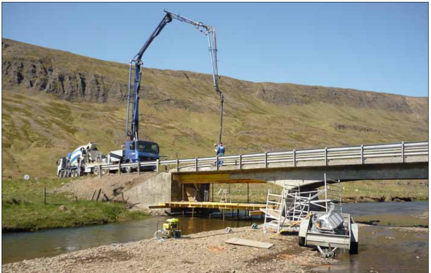
Í vor voru boðin út nokkur verkefni í viðhaldi brúa á Vestfjörðum. Þessi verk eru nú í gangi og var myndin tekin við steypuvinnu á brú yfir Tunguá í Bitrufirði í lok júní.