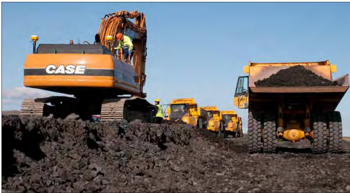
Suðurlandsvegur. Yfirhæð fjarlægð.