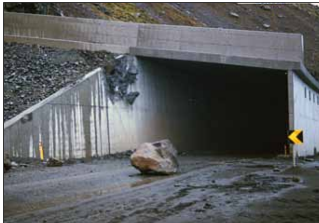
Hér hefur vegskálinn ekki einu sinni dugað til að stöðva þetta grjót.