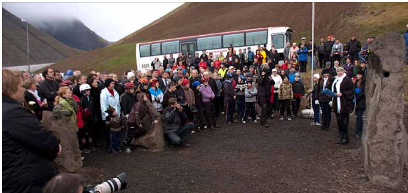
Við Skarfasker í Hnífsdal þar sem afhjúpaður var minnisvarði um þá sem farist hafa af slysförum. Skömmu síðar lagði stór hópur hjólandi, hlaupandi og gangandi vegfarenda af stað í gegnum Bolungarvíkurgöng.

Getur þar að líta eins konar göng þar sem eru steinar og borkjarnar frá gangagerðinni og myndir og fróðleikur um vegagerðina um Óshlíð á árunum 1948 til 1950 og gerð Vestfjarðarganga 1991 til 1995.