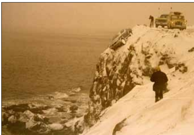
Lán í óláni 1981. Bíllinn hefur stöðvast á steini eftir að hafa lent útaf á þessum stórhættulega stað.