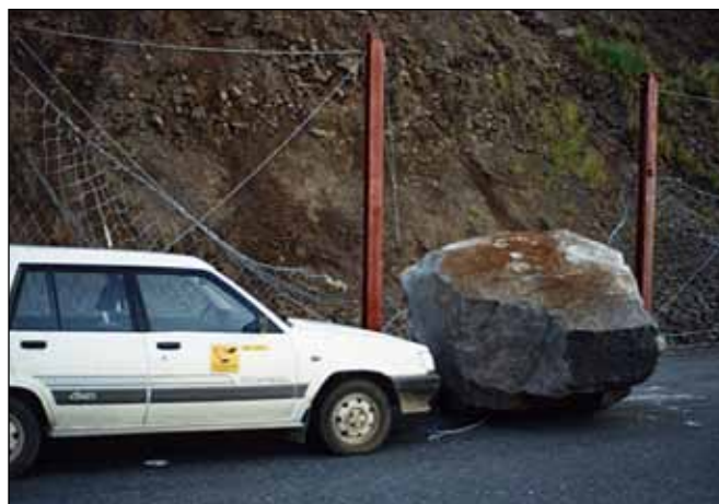
Hér hefur netgirðingin dugað skammt. Ágúst 1991.