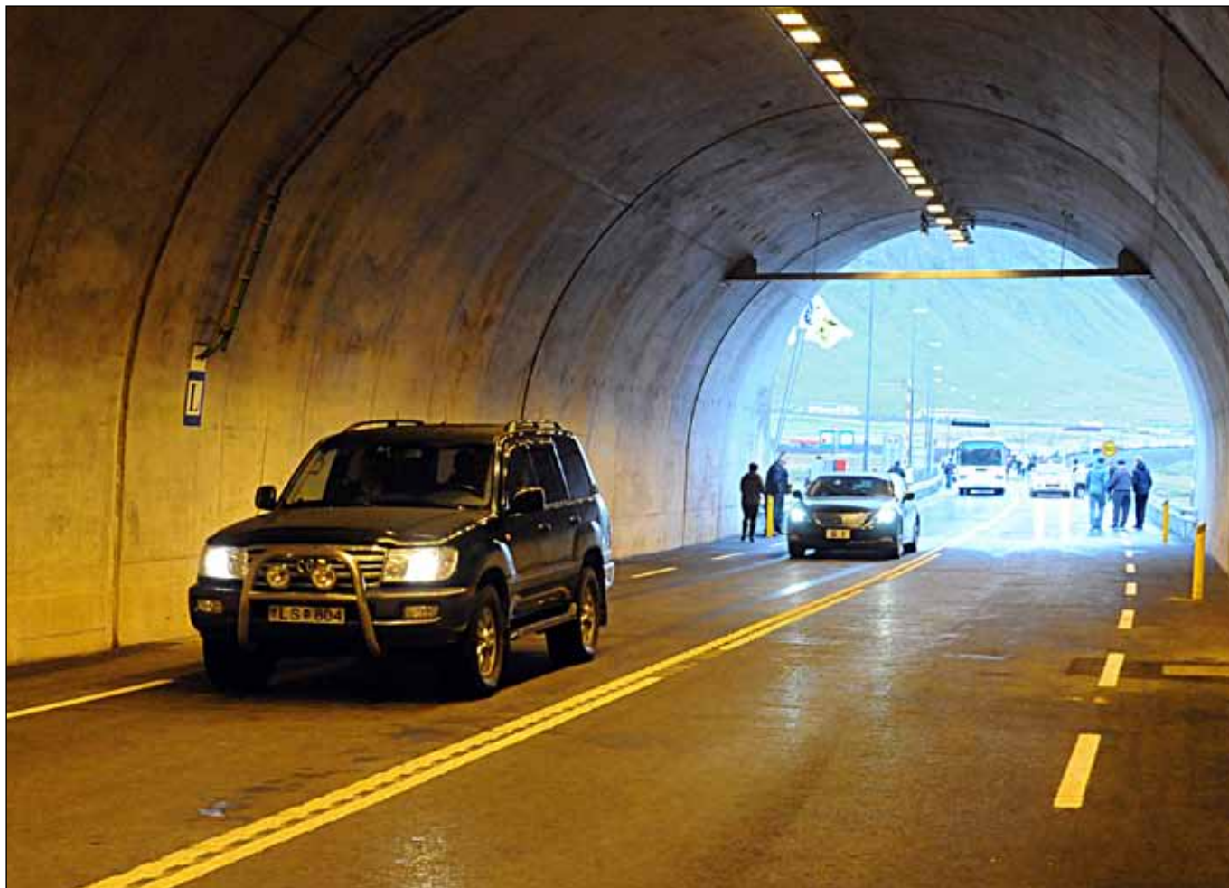
Samgönguráðherra ekur fyrstur í gegnum Bolungarvíkurgöng eftir formlega vígslu. Forseti Íslands kemur þar á eftir.