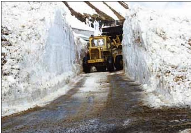
Rutt í gegnum snjóflóð 1. maí 1990.