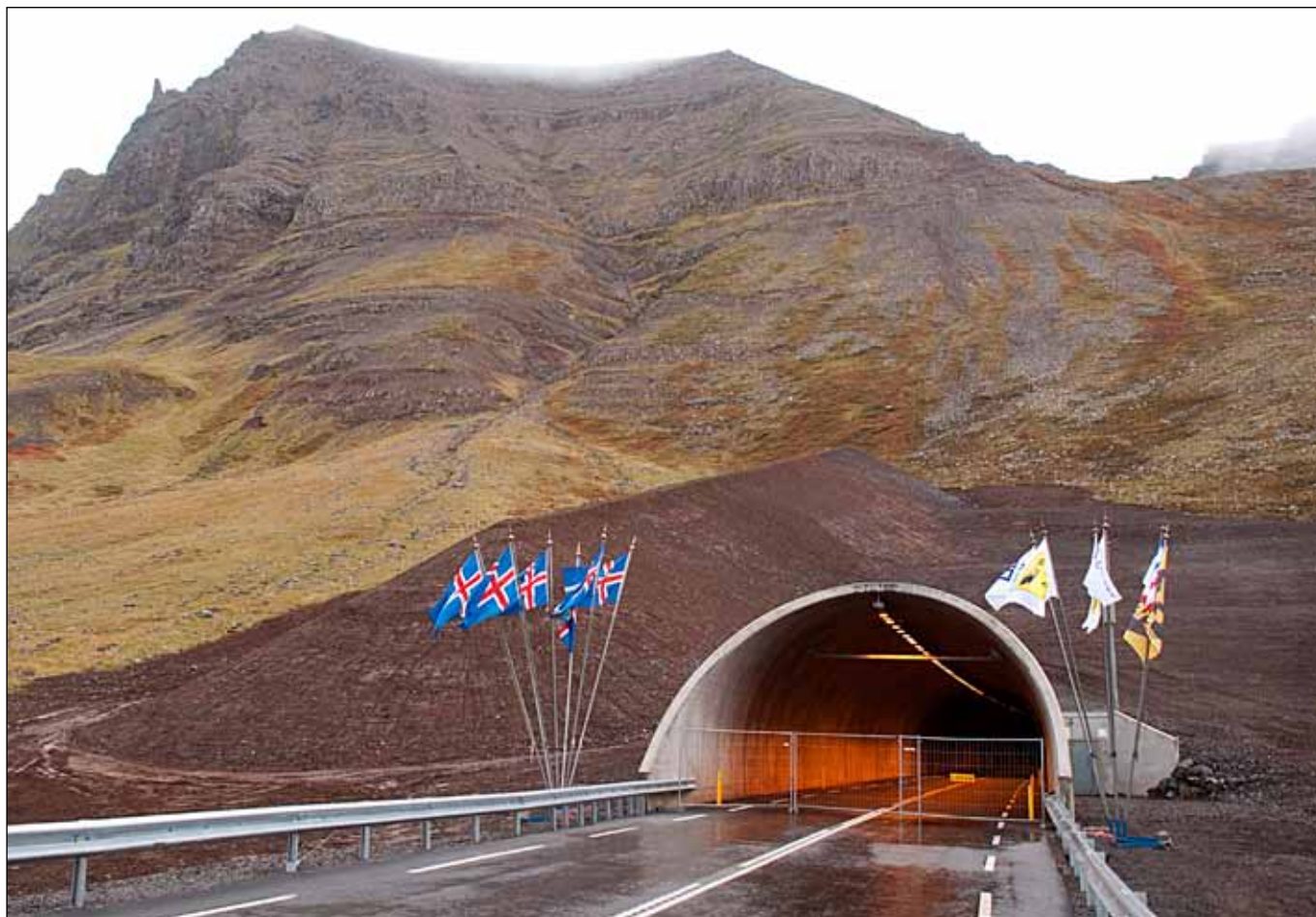
Gangamunni Bolungarvíkurganga við Bolungarvík.