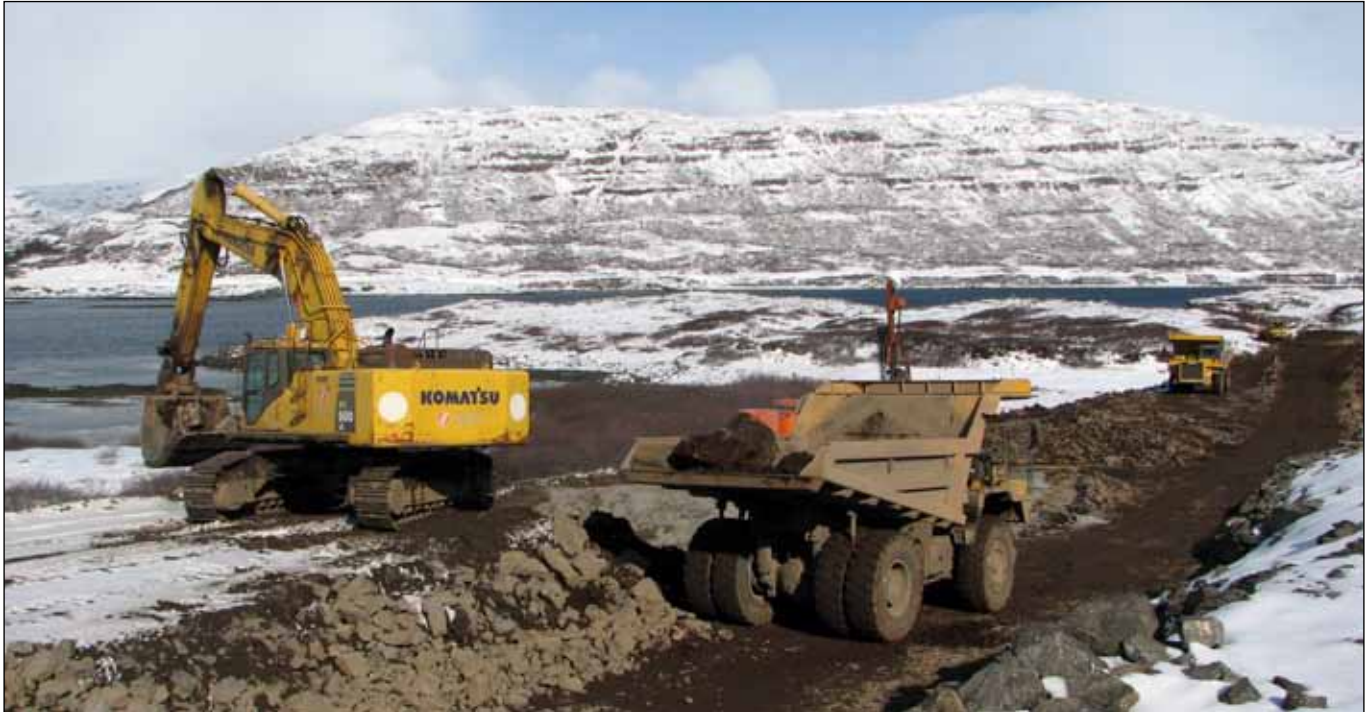
Vestfjarðavegur (60), Þverá - Þingmannaá. Verktaki: Ingileifur Jónsson ehf. Myndin er tekin í Vatsfirði 21. apríl sl.