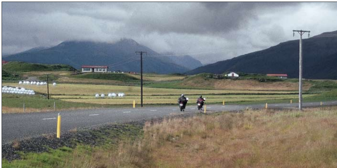
Bifhjólamenn á ferð við Hornafjörð.