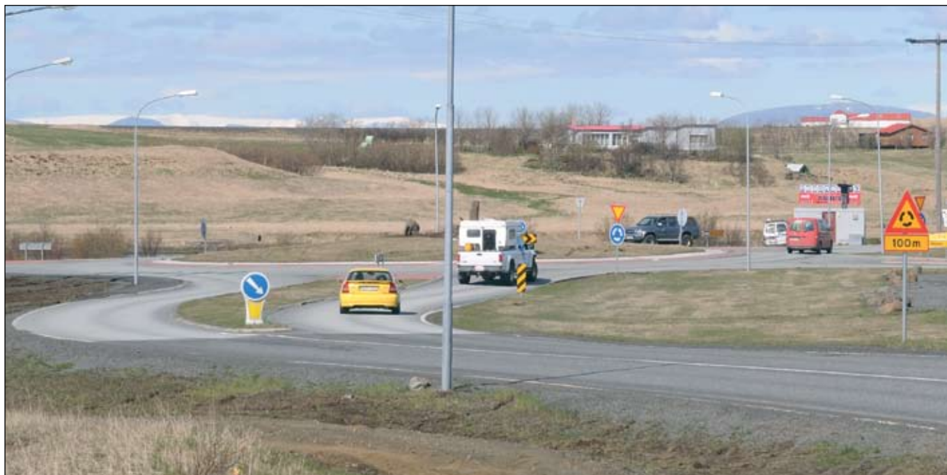
Nýlegt hringtorg á Hellu. Framhald endurbóta á Hringvegi (1) um Hellu er nú á samningaborði eftir útboð.