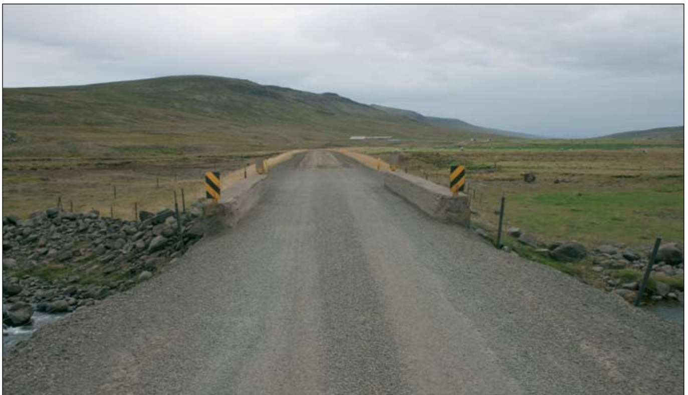
Laxárdalsvegur (59). Endurgerð 3,6 km kafla er nú á samningaborði eftir útboð.

Miðað við umferðartölur frá 16 völdum talningarstöðum á Hringvegi þá er umferðin fyrstu fimm mánuði ársins mjög svipuð og bæði í fyrra og árið 2007. Umferðin stendur þannig í stað. Þó er merkjanleg minni umferð á Suðvesturhorni landsins þar sem hún dregst saman um nærri 5 prósent í maí en svo mikil lækkun hefur ekki mælst á þessum mælum síðan árið 2005. Hafa ber í huga að Hvítasunnuhelgin var í ár um mánaðamótin maí - júní en hún var öll í maí í fyrra sem gæti skekkt samanburðinn lítillega.