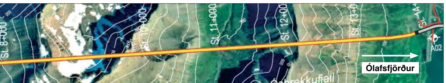
Sprengingum frá Ólafsfirði til Héðinsfjarðar lauk 9. apríl 2009.