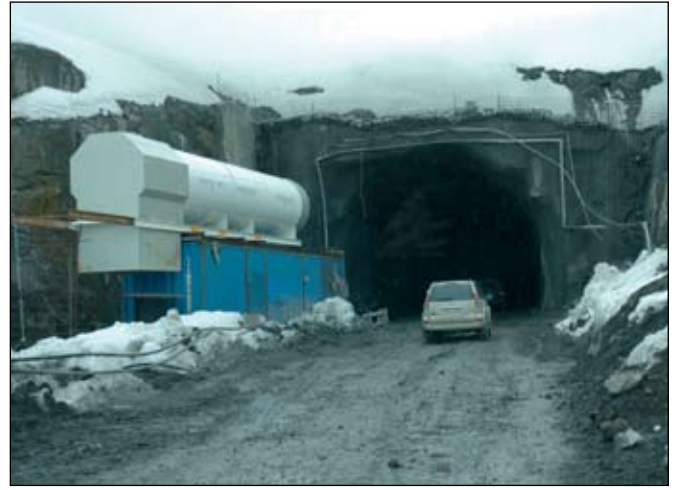
Gangamunni í austanverðum Héðinsfirði.