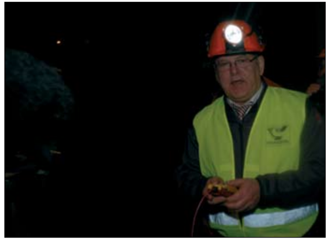
Kristján L. Möller samgönguráðherra sprengir síðasta haftið í Héðinsfjarðargöngum.

Heimild: Vefsíður Vegagerðarinnar og samgönguráðuneytis.