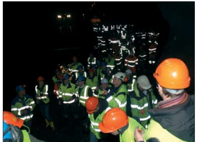
Gestir við síðustu sprengingu safnast saman eftir að haftið hafði verið sprengt og fagna áfanganum.