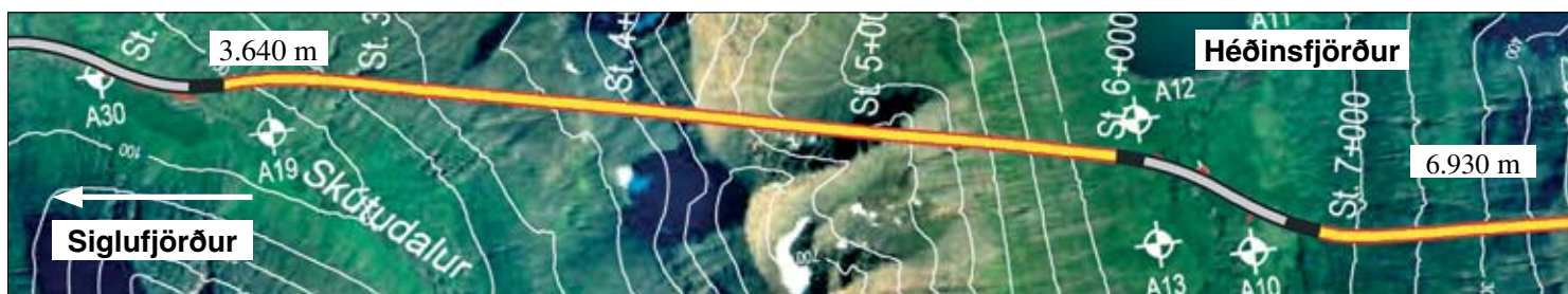
Sprengingum frá Siglufirði til Héðinsfjarðar lauk 21. mars 2008.