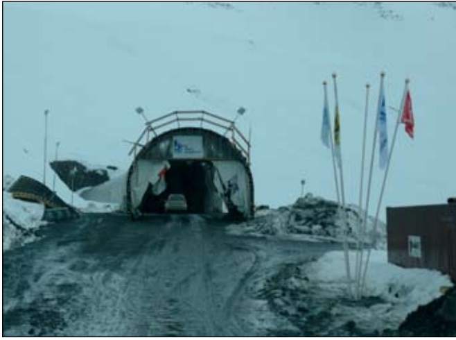
Gangamunni við Siglufjörð. Uppsteypu vegskála er lokið þar og mótin standa tilbúin fyrir næsta áfanga.