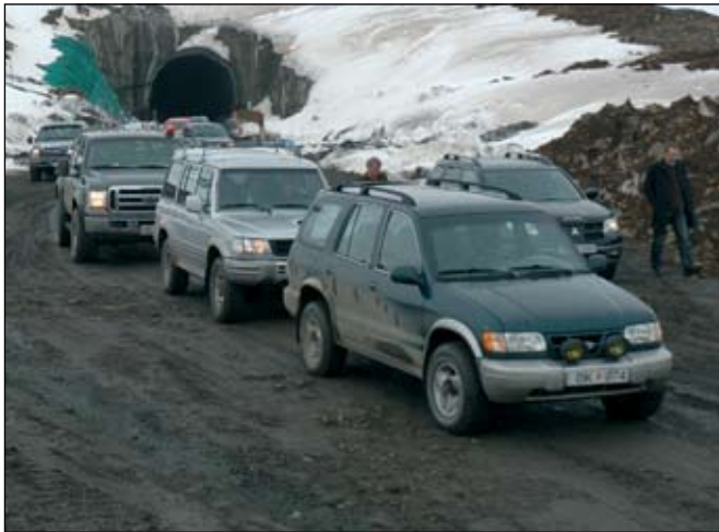
Gestir aka út úr göngum í vestanverðum Héðinsfirði.