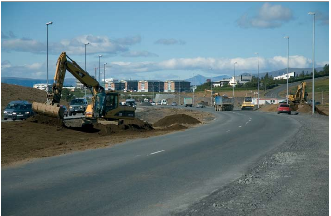
Nú sér fyrir endann á tvöföldun Reykjanesbrautar um Garðabæ og Hafnarfjörð. Búið er að hleypa umferð á allan kaflann en unnið er við frágang.

Á grundvelli kostnaðaráætlunar og útboðslýsingar Navís Fengs buðu Ríkiskaup verkefnið út á Evrópska efnahags-