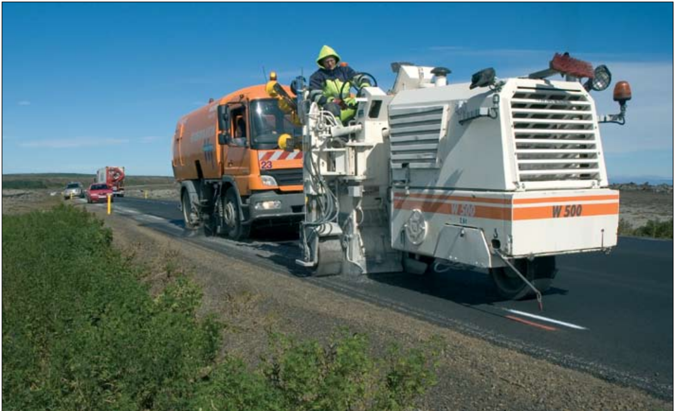
Vegrifflur fræstar í Grindavíkurveg.