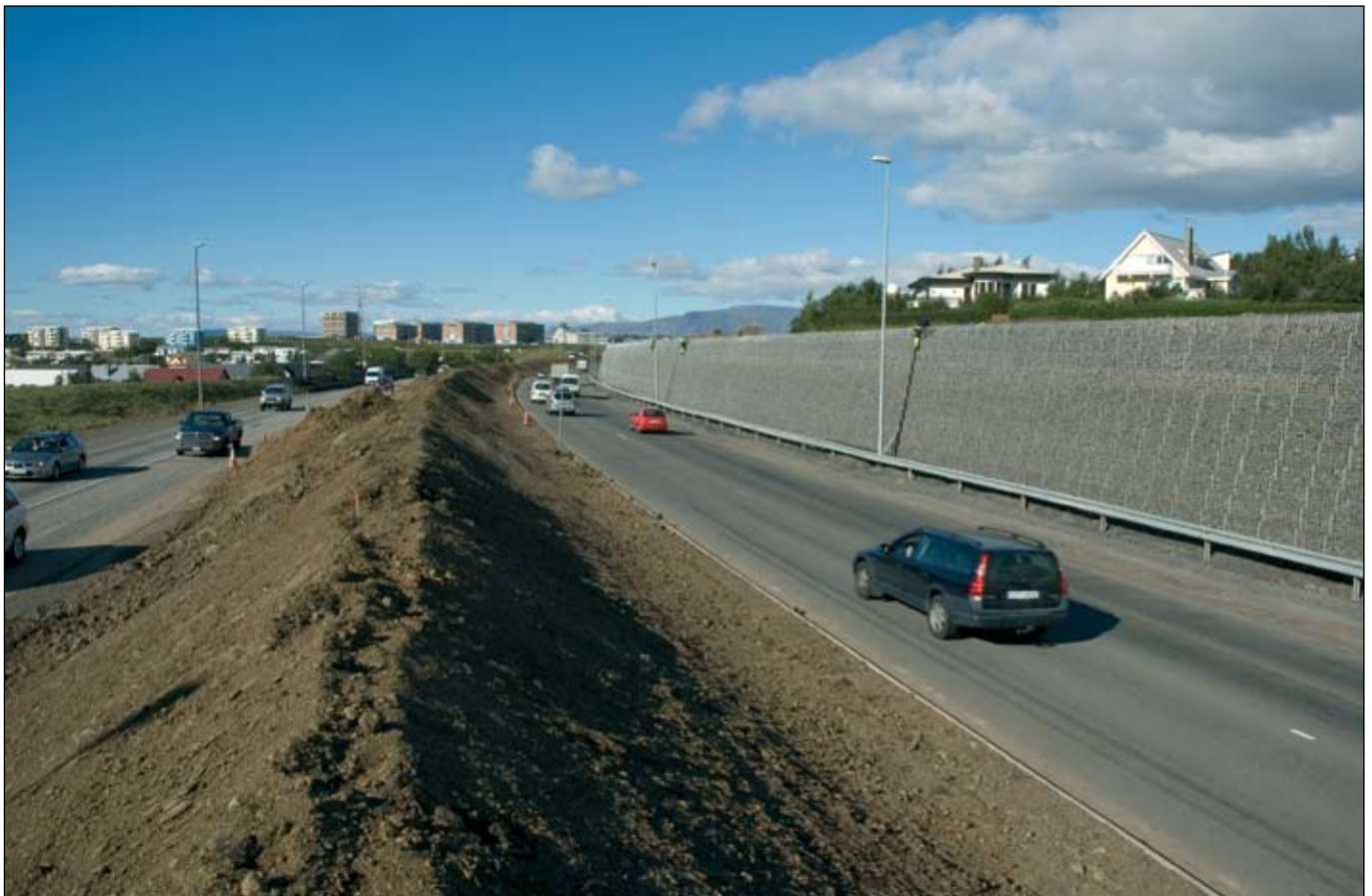
Reykjanesbraut í Garðabæ. Unnið er við frágang hljóðmanar í miðeyju og stoðveggjar.

Almennt á það við í samningum sem þessum að óskað er tilboða frá verksala í aukaverk og síðan gerður formlegur samningur á grundvelli þeirra. Ákvæði þessa efnis er í samningnum um endurbætur á nýrri Grímseyjarferju. VOOV hefur nær aldrei skilað formlegum tilboðum í aukaverk þrátt fyrir ítrekaðar tilraunir eftirlitsaðila til að fá slík tilboð. Verkin