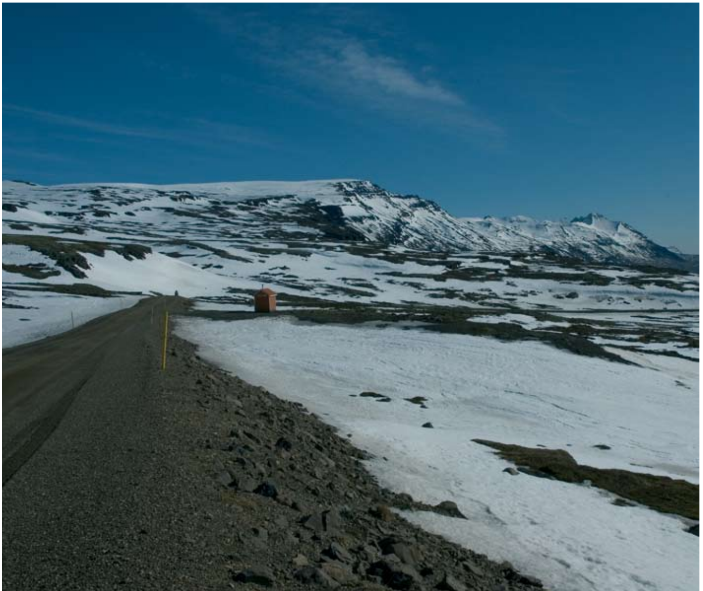
Hringvegur (1) á Breiðdalsheiði.