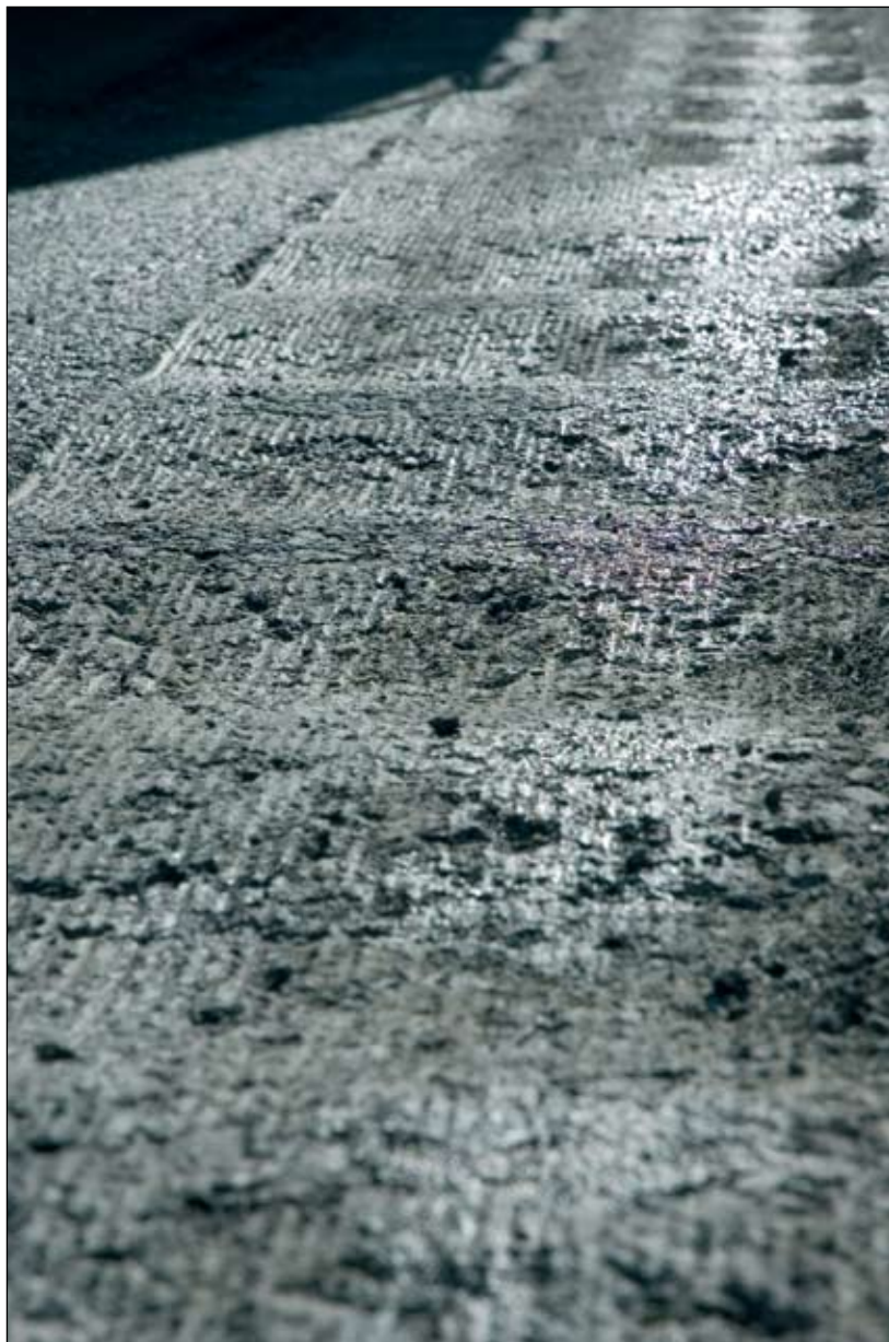
Grindavíkurvegur, fræstar vegriffur.

Þá voru þeir sem reynsluna höfðu sammála um að riffur séu til bóta, ódýr kostur sem bjargi mannlífum. Riffur eru þó ekki alveg án gagnrýni en hún beinist fyrst og fremst að hávaðamengun.