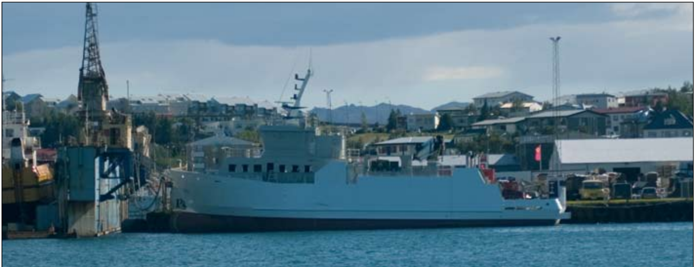
Ný Grímseyjarferja í Hafnarfjarðarhöfn 13. ágúst.

Loks telur Ríkisendurskoðun ástæðu til að gagnrýna harðlega þá staðreynd að nú þegar hafa verið greiddar tæplega 400 m.kr. úr ríkissjóði til verksins, en í 6. grein fjárlaga 2006 er aðeins veitt heimild til „að selja Grímseyjarferjuna m/s Sæfara og ráðstafa andvirðinu til kaupa eða leigu á annarri hentugri ferju“. Samkvæmt samkomulagi fjármálaráðuneytisins, samgönguráðuneytisins og Vegagerðarinnar hafa bæði kaupin og endurbæturnar verið fjármögnuð með ónýttum heimildum Vegagerðarinnar. Þegar kaupin voru gerð og