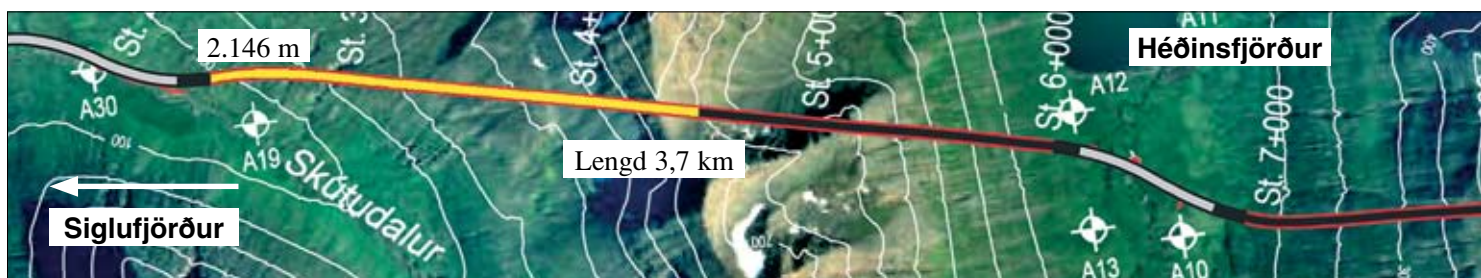
Staða framkvæmda við Héðinsfjarðargöng 13. ágúst 2007. Búið er að sprengja 2.146 m í Siglufirði og 1.701 m í Ólafsfirði.

Vinna við gröft Héðinsfjarðarganga frá Ólafsfirði gekk vel í viku 32. Lengd ganga þeim megin frá er nú 1.701 m og lengdust göngin þar um 55 m í vikunni. Minni háttar bergþéttingar fóru fram þar í vikunni. Siglufjarðarmegin gekk hægar vegna umfangsmeiri bergþéttinga auk þess sem unnið var að gerð neyðarútskots. Lengd ganga þar er nú um 2.146 m og lengdust göngin þeim megin frá um 27 m í vikunni. Samanlögð lengd ganga er nú um 3.847 m sem er um 36,3% af heildarlengd.