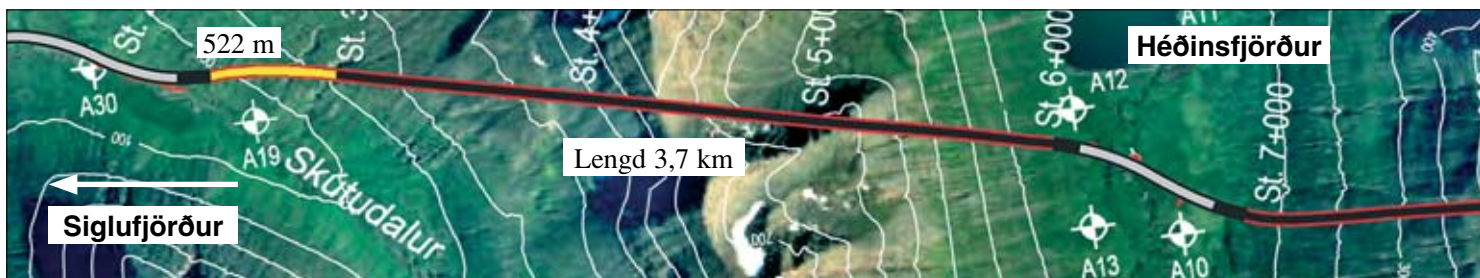
Staða framkvæmda við Héðinsfjarðargöng II. desember 2006.