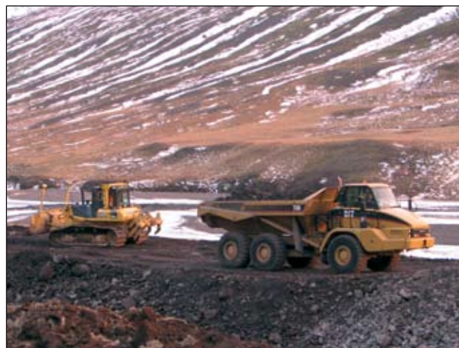
Vegaframkvæmdir í Norðurárdal í Skagafirði, 29. nóvember 2006.