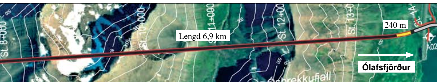
Búið er að sprengja 522 m í Siglufirði og 240 m í Ólafsfirði. Samtals er búið að sprengja 762 m.