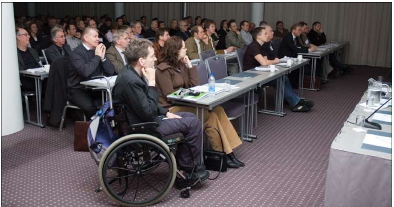
Frá ráðstefnu þróunarsviðs Vegagerðarinnar um rannsóknir á Hótel Nordica 11. nóvember 2005.

Nýting svarðlags við uppgræðslu námusvæða