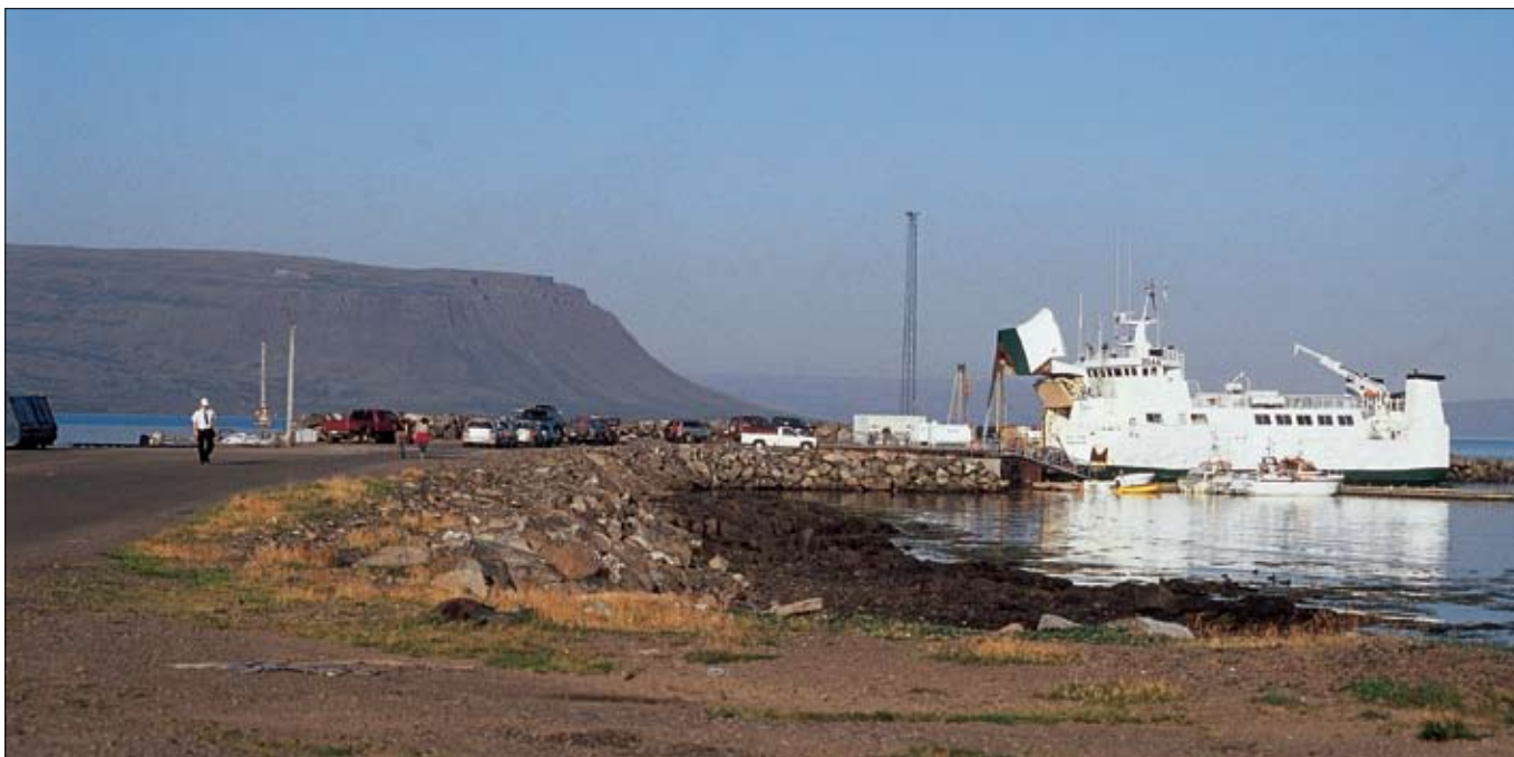
Þetta skip fór í sína síðustu siglingu sem Breiðafjarðarferjan Baldur föstudaginn 31. mars. Stærri skip mun nú taka við þessu hlutverki. Myndin er tekin á Brjánslæk.