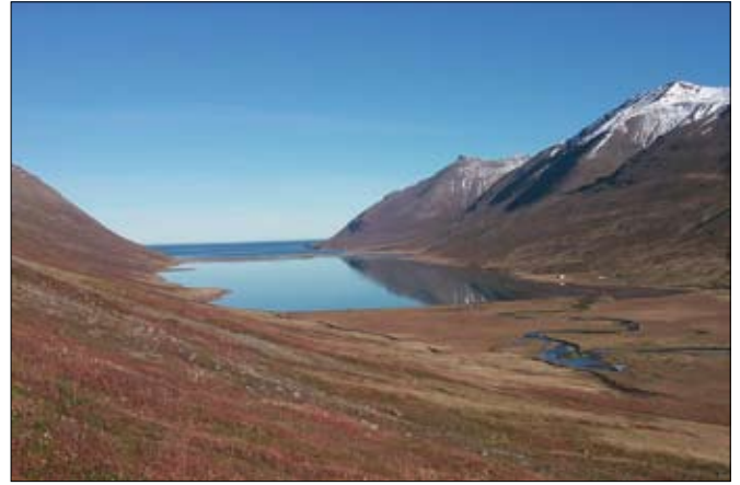
Horft úr vesturhlíð Héðinsfjarðar, norður yfir Héðinsfjarðarvatn. Vegur milli jarðgangamunna fer þvert yfir dalbotninn innan við vatnið.

Héðinsfjarðar og Ólafsfjarðar verði grafin frá báðum endum, þ.e. frá Ólafsfirði og Héðinsfirði. Gangagröftur í Héðinsfirði á mót gangagreftri frá Ólafsfirði er ekki heimilaður fyrr en gangagreftri frá Siglufirði til Héðinsfjarðar er lokið. Verkkaupi mun hreinsa ofan af klöppinni fyrir gangaendum í Héðinsfirði. Ennfremur hefur verkkaupi gert vinnuslóða við hliðina á vegstæði að munnum jarðganga í Skútudal og Ólafsfirði.