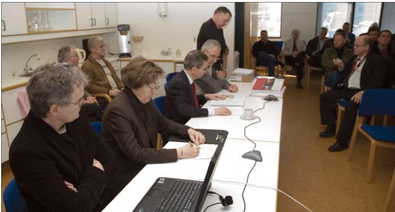
Frá opnun tilboða í gerð Héðinsfjarðarganga 21. mars 2006.