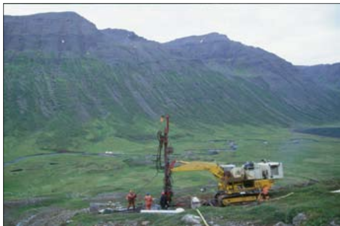
Um 350 m djúp kjarnahola var boruð upp af Grundarkoti, í austurhlíð Hédinsfjarðar sumarið 2000.

Hédinsfirði á verktímanum og aðkoma hans að vinnusvæðinu þar verði um jarðgöngin.