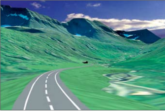
Vegur og gangamunni í Siglufirði. Tölvuteikning: Teikn á lofti.