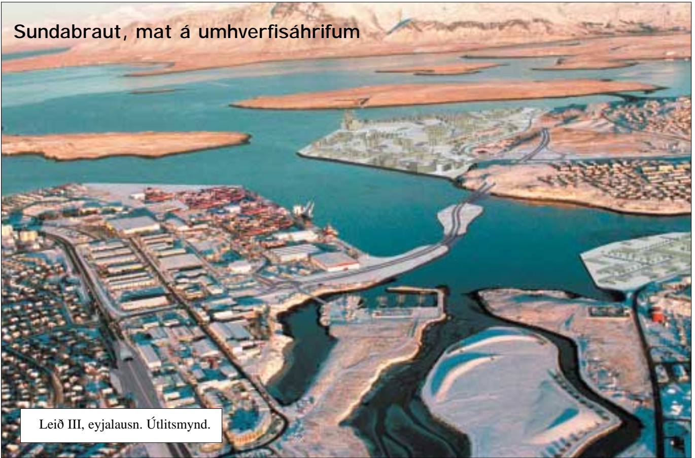
Leið III, eyjalausn. Útlitsmynd.

Komin er út skýrsla um mat á umhverfisáhrifum Sundabrautar. Matið er unnið af verkfræðistofunni Línuhönnun fyrir Vegagerðina og Reykjavíkurborg og fjallar um umhverfisáhrif 1. áfanga framkvæmdarinnar. Skýrslan liggur á vef Vegagerðarinnar, vegagerdin.is , og er tenging af fréttalista á forsiðu. Nú er verið að halda kynningarfundum um matið og er fundur auglýstur á útkomudegi þessa tölublaðs, mánudaginn 21. júní, kl. 20 í félagsheimili Þróttar í Laugardal. Fundurinn er öllum opin.