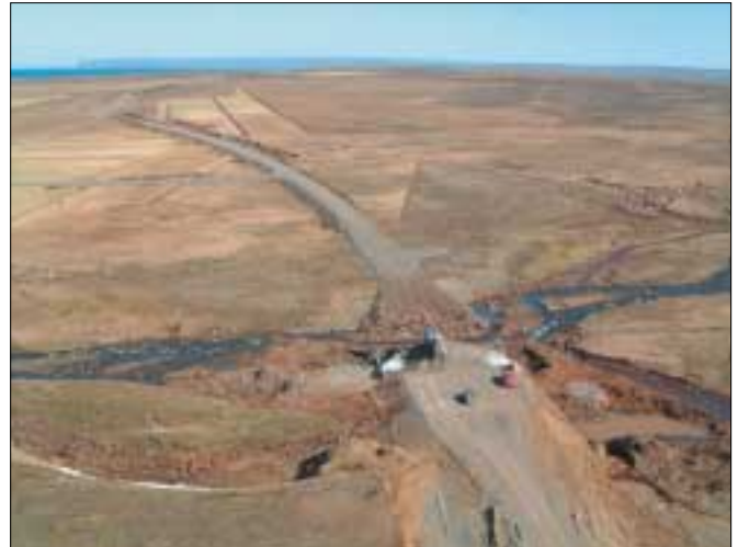
Norðausturvegur (85). Hólkur settur í Saurbæjará í Finnafirði og veglína lagfærð. 24. maí 2004.