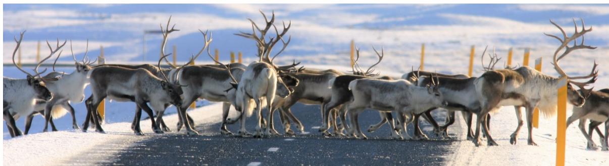
Hreindýr á Háreksstaðaleið.

Árekstrar við hreindýr verða einkum á veturna þegar aðstæður til aksturs eru slæmar, hálka, myrkur og lélegt skyggni á sama tíma og hreindýr leita í auknum mæli niður á láglandið í nágrenni við vegi. Keyrt hefur verið á am.k. 295 dýr á tímabilinu 1999 til apríl 2018. Æskilegt er að draga eins og hægt er úr árekstrum við hreindýr, mönnum og dýrum til heilla.