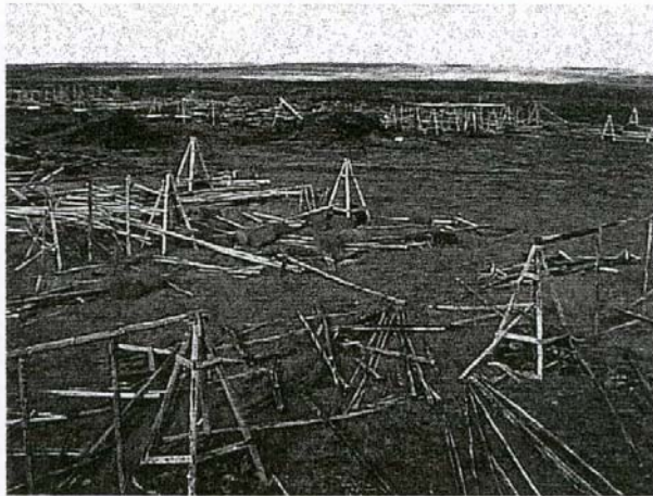
Mynd 1. Arnarseturshraun. Gömul náma suðvestan við Snorra- staðatjarnir eftir margra ára hvíld. Mosi, krækilyng o.fl. skýtur kollu upp úr námugólfinu.