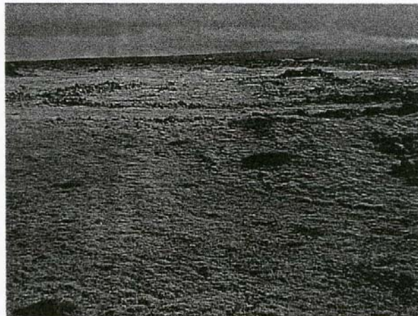
Mynd 2. Mosavaxið námugólf í Arnarseturshrauni.