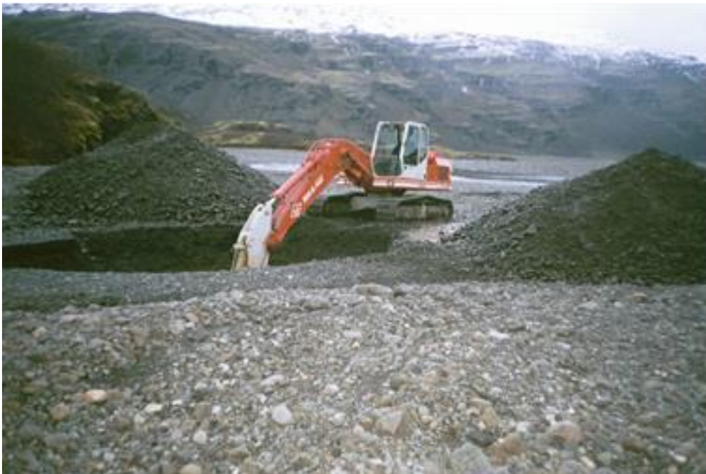
Mynd 3 Rannsóknargryfja við Jökulsá í Lóni.

Æskilegt er að gefin verði út jarðgrunnskort af landinu en slík kort hafa nær einungis verið gefin út af virkjunarsvæðum. Nákvæmari vitneskja um magn og dreifingu lausra jarðlaga myndi stuðla að hagkvæmari og umhverfisvænni nýtingu þeirra þannig að t.d. hágæðaefni og merkilegar setmyndanir séu ekki ofnýttar. Þegar um nýja efnistökuastaði er að ræða er gerð úttekt á fyrirhuguðu námusvæði, til magn- og gæðakönnunar, með greftri í setnámum og borunum í bergnámum. Stöku sinnum er beitt jarðeðlisfræðilegum aðferðum svo sem jarðsjá til að rannsaka þykkt og lagskiptingu setlaga. Oft þarf einnig að rannsaka eldri námur ef litlar upplýsingar liggja fyrir um námuna. Rannsóknir beinast að því að kanna þykkt jarðvegs sem ýta þarf ofan af, skrá millilög í efninu og mæla þykkt efnisins sem á að vinna, þ.e. dýpi á klöpp eða dýpi niður að setlagi af lakari gæðum sem ekki er sóst eftir til efnistöku. Einnig er mæld vatnsstaða í gryfjunni. Tekin eru sýni af efninu og þau send til berggæðarannsókna á rannsóknastofu. Mynd 3 sýnir gerð rannsóknargryfju.