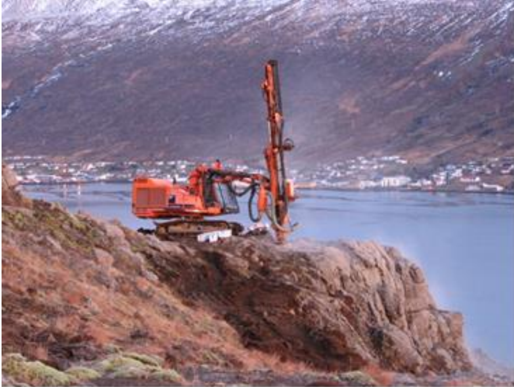
Mynd 4 Borað í klöpp á Hólmahálsi við Eskifjörð.

Borun í berg getur bæði verið svarfborun og kjarnaborun. Með svarfborun er hægt að mæla borhraða, sem gefur hugmynd um eiginleika bergsins og lagskiptingu auk þess sem hægt er að taka sýni af svarfinu til berggreiningar. Kjarnaborun gefur mun gleggri mynd af lagskiptingu bergsins og millilögum en auk þess er æskilegt að taka kjarna af berginu til að rannsaka bergtæknilega eiginleika þess á rannsóknastofu.