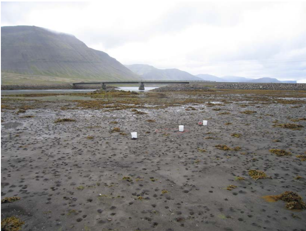
Mynd 3. Leirusnið 1 í Dýrafirði. Stöð B er þar sem föturnar eru.