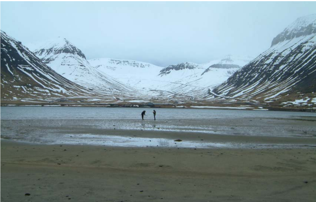
Mynd 5. Leirusnið í Holtsodda í Önundarfirði.