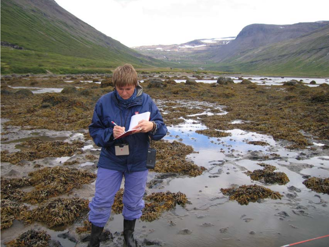
Mynd 4. Leirusnið 2 í botni Dýrafjarðar. Verið er að skrifa niður lýsingu.