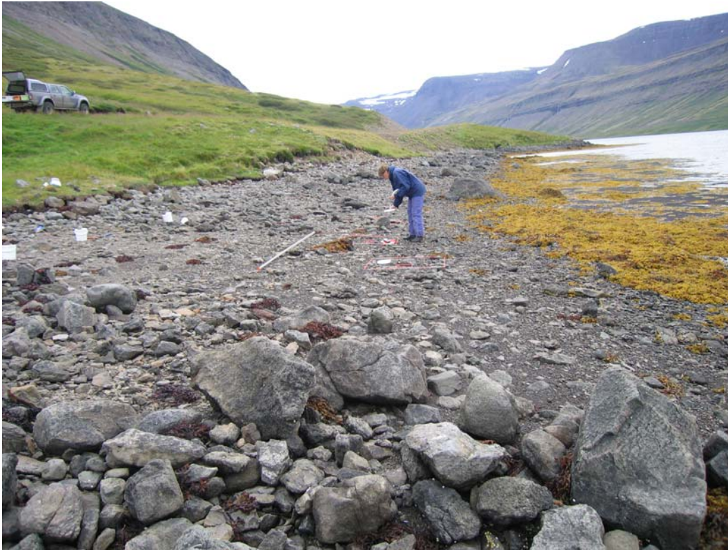
Mynd 2. Fjörusnið 3 í Dýrafirði.