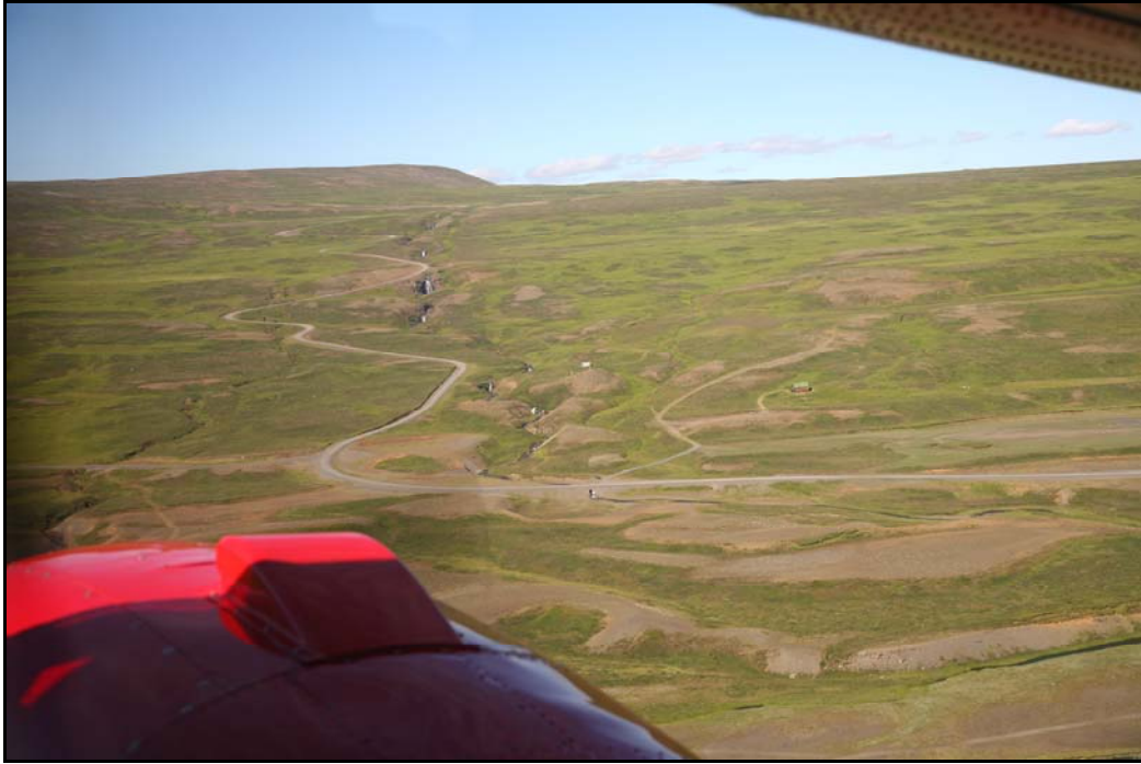
Mynd 2. Núverandi vegur um Bustarfellsbrekkur (Hörður Geirsson, ágúst 2006).