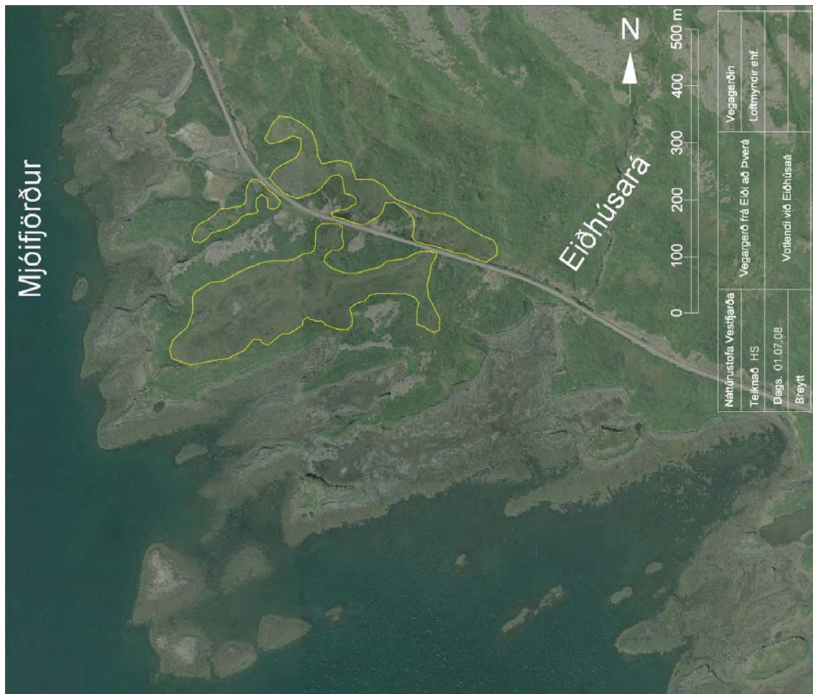
Mynd 2. Votlendi við Eiðshúsaá, útlínur þess svæðis eru gular.