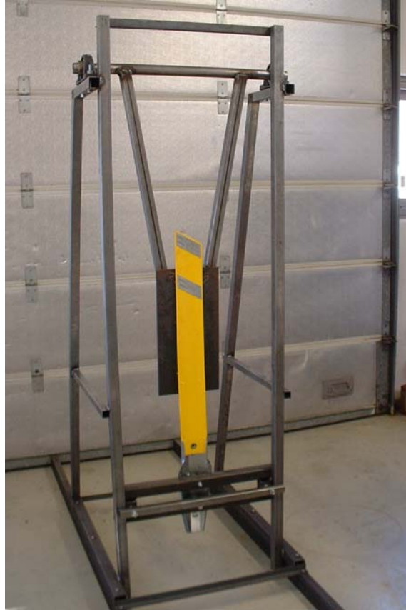
Mynd 2. Höggþolstækið sem smíðað var fyrir þessar prófanir.