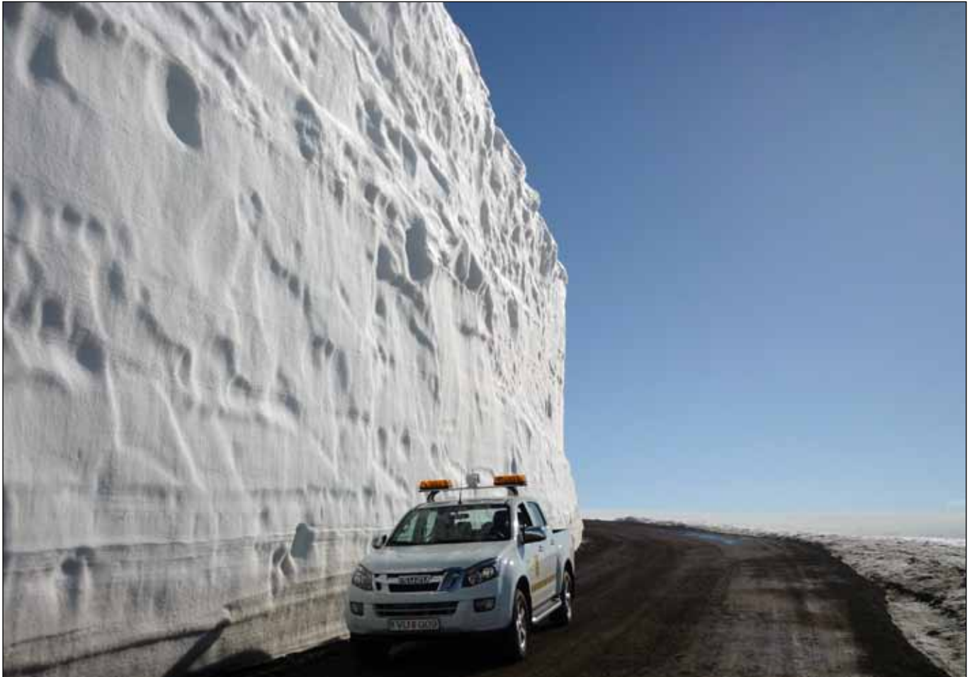
Hrafnseyrarheiði í Skipadal 28. apríl 2014.