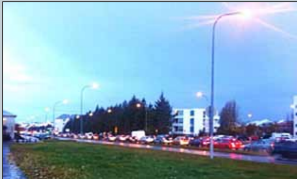
Umferð á Miklubraut.

► önnur svið. Það er því vandasamt að finna bestu mögulegu útfærslu á fleytitíð og reynir hún á samvinnu allra vinnustaða á svæðinu. Í tengslum við verkefnið var gerð ferðavenjukönnun hjá stofnuninum og bent er á að vinna megi frekar úr henni, til dæmis hægt að fá mat á hvað þarf að gera til að breyta ferðavenjum.