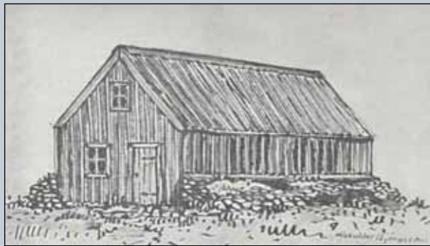
Seluhúsið á Kolviðarhóli, byggt 1844

Í ritinu er fjallað almennt um fornar götur hér á landi, vörður, forsögu vegambóta og þróun samgöngumála með áherslu á elstu Reykjavíkurléiðirnar fornu. Götunum sjálfum er sérstaklega lýst sem og vörðum, skjólum og fleiru sem þeim tengjast. Fjallað er um hugsanlegan aldur minja,