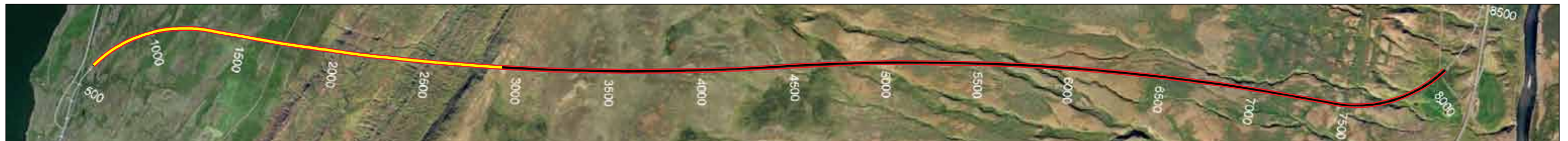
Vaðlaheiðargöng, staða framkvæmda 5. maí 2014. Búið er að sprengja 2.289 m frá Eyjafirði sem er 32% af heildarlengd.