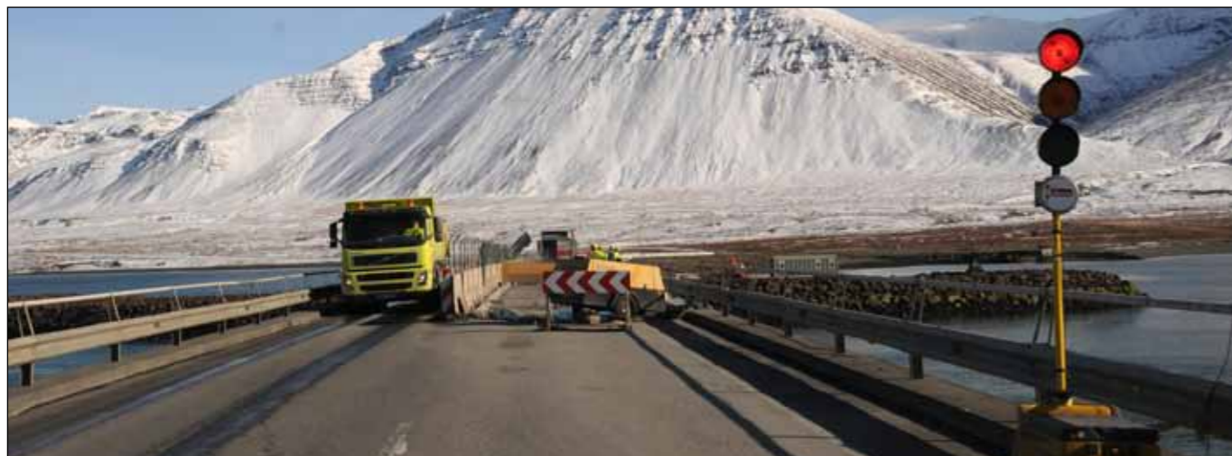
Vegna framkvæmda við brúargólf Borgarfjarðarbrúar er lokað fyrir umferð á annari akrein á hluta brúarinnar. Notast verður við ljósastrýngar fyrir umferð. Framkvæmdir munu standa yfir frá 2. maí til 13. júní. Myndin var tekin við samskonar framkvæmd vorið 2013.