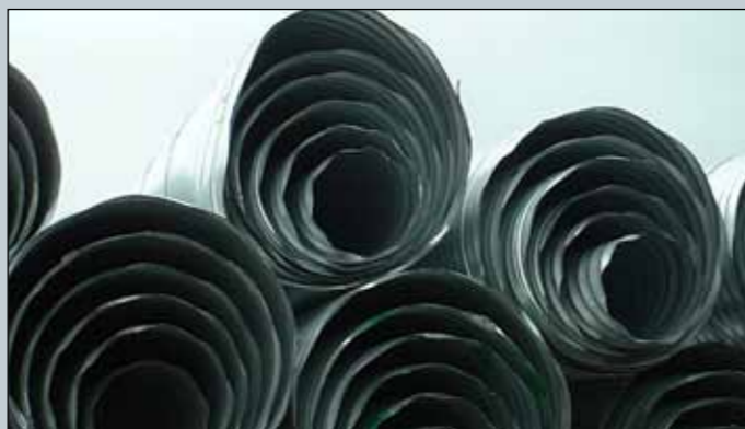
Ræsarör á lager.

► gátlista, eyðublöð og þ.h. fyrir rekjanleikann. Kröfulýsingar eru til fyrir suma vöruflokka sem og upplýsingar um hvort og þá hver skuli gera úttekt eða rannsókn við afhendingu vöru en það vantar víða. Í framhaldi af þessari yfirferð, var hafist handa við að vinna tillögur að endurbættu kerfi og gerð voru flæðirit fyrir innkaupin. Í skýrslunni eru flæðiritin birt ásamt leiðbeiningum og eyðublöðum. Nú er unnið að innleiðingu kerfisins hjá Vegagerðinni. ■