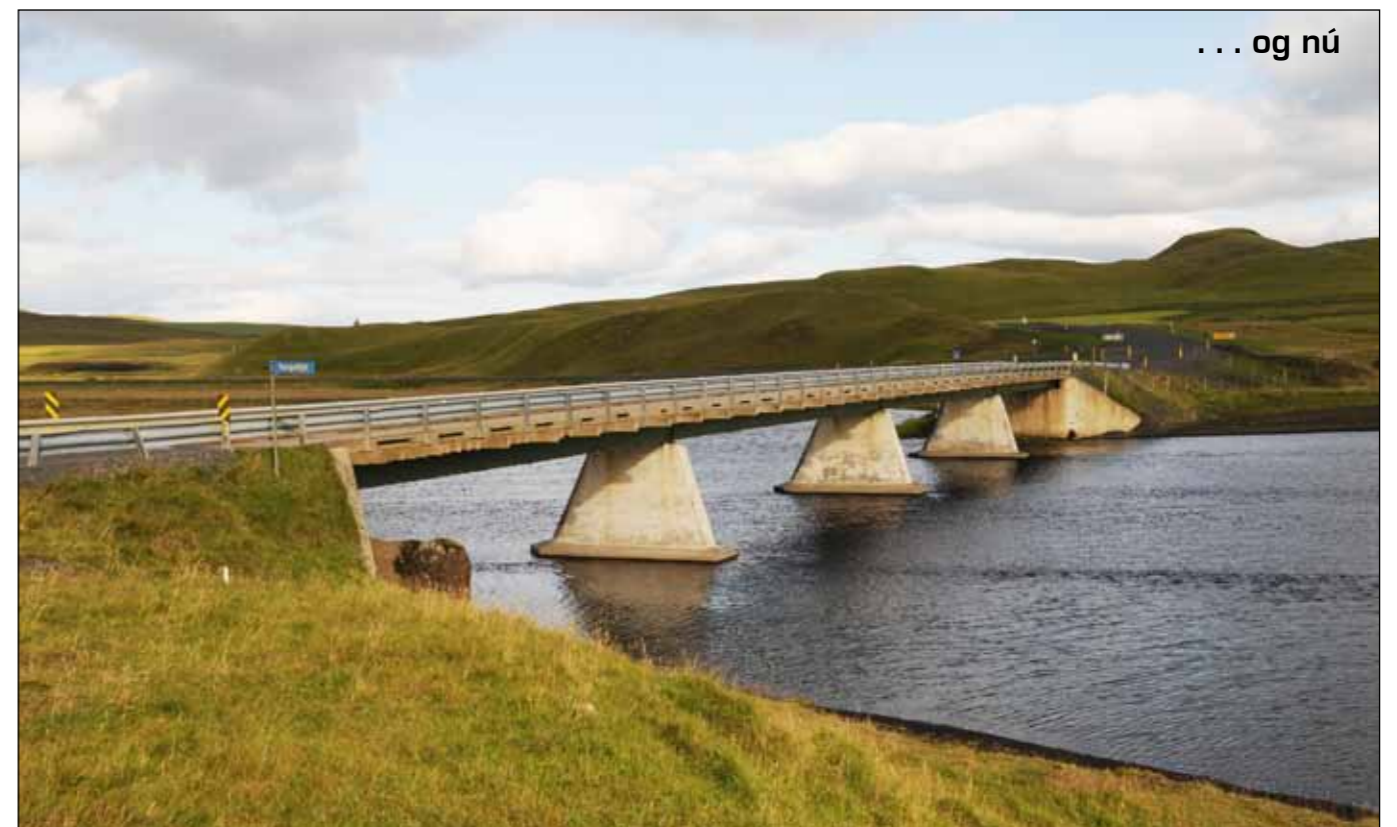
Núverandi brú á Tungufljót í Skaftártungu var byggð 1959. Hringvegur (1) lá um þessa leið þar til brú var byggð á Kúðafljót 1993. Síðan þá heitir þessi vegur Hrfunesvegur (209) en austan ár endar hann við Skaftártunguveg (208).