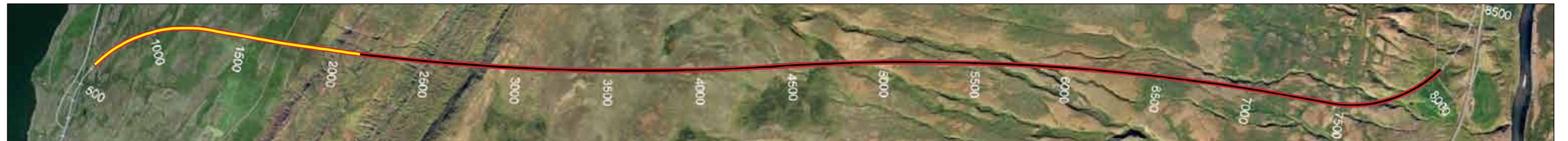
Vaðlaheiðargöng, staða framkvæmda 20. janúar 2014. Búíð er að sprengja 1.518 m frá Eyjafirði sem er 21% af heildarlengd.