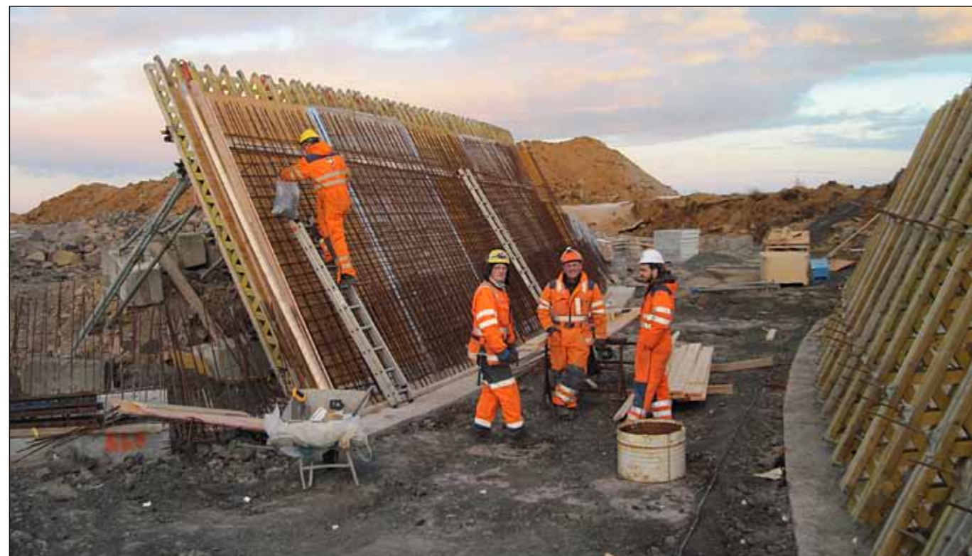
Álftanesvegur. Gerð undirganga. Verktaki ÍAV hf., Myndin var tekin 14. janúar sl.