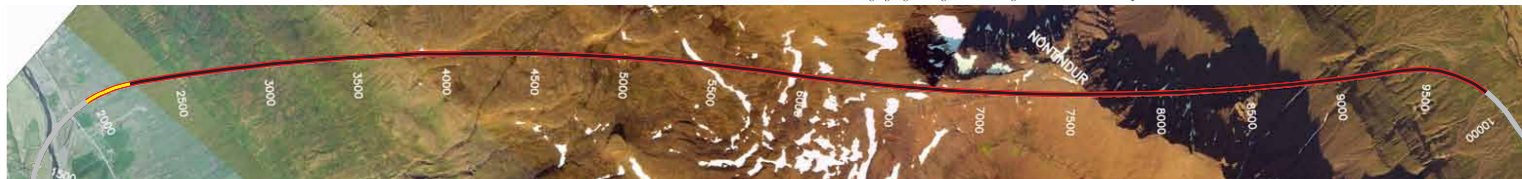
Norðfjarðargöng, staða framkvæmda 20. janúar 2014. Búíð er að sprengja 406 m frá Eskifirði sem er 5,3% af heildarlengd.