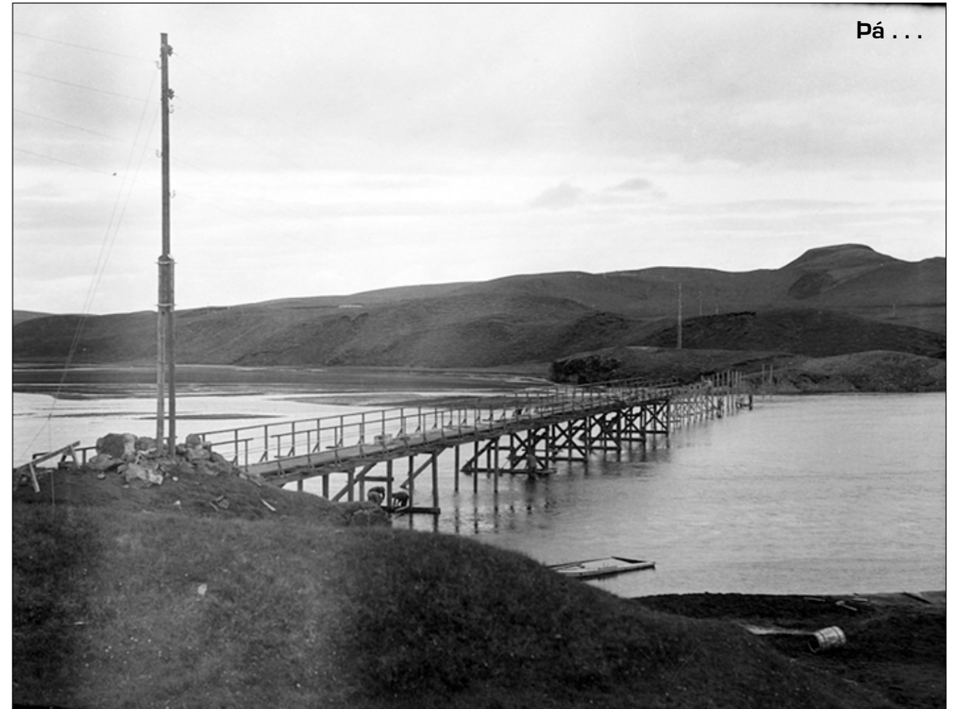
Tungufljót í Skaftártungu, járnbitabrú á stauraokum. Byrjað var að byggja brúna 1929 en því lauk ekki fyrr en árið eftir. Ekki er gott að segja hvort sumarið myndin er tekin. Síðar var brúin endurbyggð, m.a. settur grindarbiti yfir austasta hafið.