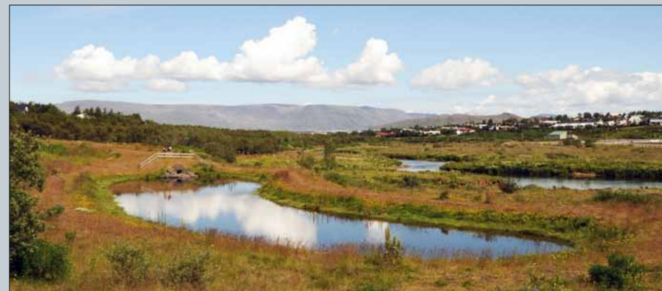
Manngerð settjörn við Elliðaár sem tekur við yfirborðsvatni frá Breiðholtshlíðum.

Fram kemur að vinna við innleiðingu vatnatilskipunarinnar