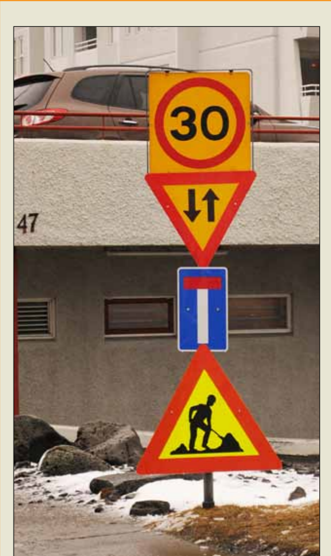
Þessi merking er við vinnusvæði í vesturbæ Reykjavíkur. Parna hefur einstefnugötu verið lokað að hluta og tekin upp tímabundin tvístefna. Ágæt merking en samt er eitthvað ekki alveg eins og það á að vera.

Skila skal tilboðum á sömu stöðum fyrir kl. 14:00 þriðjudaginn 17. mars 2015 og verða þau opnuð þar kl. 14:15 þann dag.