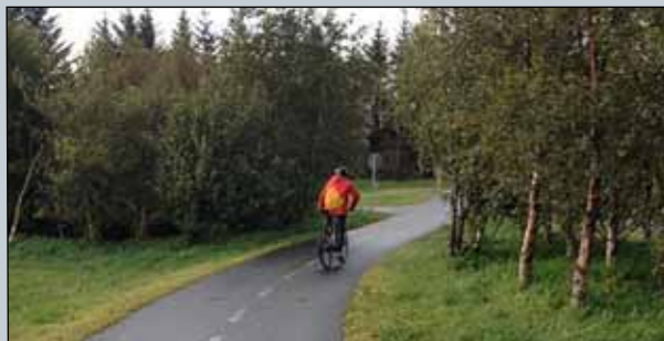
Hjólastígur í Fossvogi.

Þá er sett fram dæmi um öryggisúttekt hjólastígs, Fossvogsstígs frá Fossvogsbúri yfir Kringlumýrarbraut að hringtorgi við Elliðaár. Fleiri slíkar skýrslur verður að finna á vef Landssamtaka hjólréiðamanna ( www.lhm.is ).