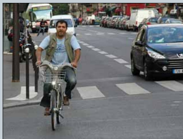
Hjólað í París.

Tilgangur verkefnisins var að afla upplýsinga frá nágrannalöndum okkar um það hvernig umferð hjólréidamanna við mismunandi aðstæður á gatnamótum og þar sem stígar þvera götur er meðhöndluð. Í skýrslunni er vitnað til samantektar Vegagerðarinnar um slys með alvarlegum meiðslum á tímabilinu 2011-2013, þar sem fram kemur