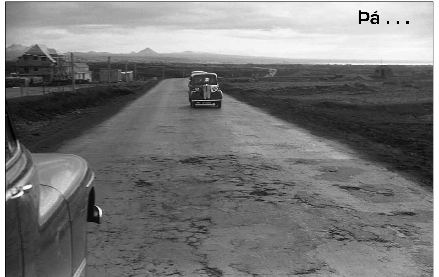
Sami staður með 66 ára millibili, 1947 og 2013. Fyrstu tilraunir landsmanna til að leggja bundið slitlag tókust misvel. Hjá Vega-gerðinni eru til fjölmargar myndir sem voru teknar eftir seinna stríð af bundnu slitlagi í og við Reykjavík. Þessar myndir sýna sumar skemmtilegt sjónarhorn á borgina og nágrenni hennar þótt það hafi ekki verið endilega tilgangurinn með myndatökunni. Myndin hér að ofan sýnir gamla Hafnarfjarðarveginn þar sem hann liggur