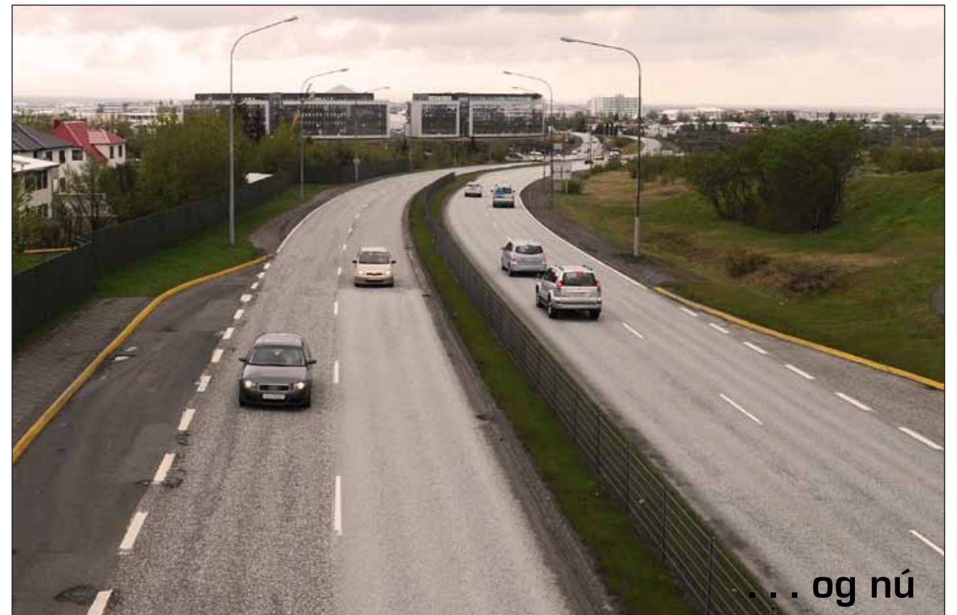
... og nú