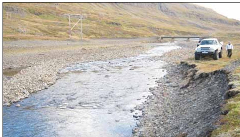
Fjarðarhornsa, stöð 1 (við bílinn). N65°38.807 - V22°32.903