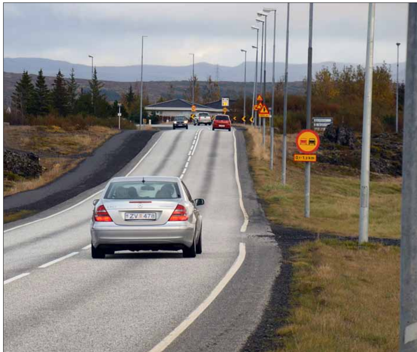
Núverandi Álftanesvegur. Myndin er tekin með miklu aðdrætti í október 2012 og sýnir vel merkingar sem eru nauðsynlegar vegna umferðaröryggis á þessum kafla.

„Ófeigskirkja mun fara undir veginn segja Hraunavinir. Eftir því sem næst verður komist er allsendis óvíst hvar Ófeigskirkju er að finna. Heimildum ber ekki saman og fræðimenn hafa leitt að því líkum að hún hafi farið undir núverandi veg. Ófeigskirkja verður því traudla notuð sem rök eða vissa í málinu.“ ■