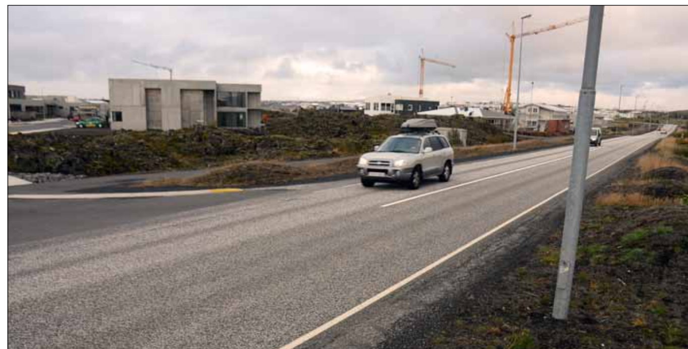
Núverandi Álftanesvegur. Myndin er tekin í október 2012. Prýðishverfið í byggingu.

„Þessi kostur felur í sér lagfæringar á hæðarlegu núverandi vegar án þess að færa veginn til í plani svo nokkru nemi. Beygjur verða því áfram krappar og uppfylla alls ekki kröfur sem gerðar eru til vegar af þessu tagi. Núverandi byggð við Álftanesveg setur lagfæringum af þessu tagi mjög þröngar skorður. Því er fyrirsjáanlegt að veltæknilégar kröfur verði ekki uppfylltar nema með tilfærslu frá núverandi vegarstæði.“