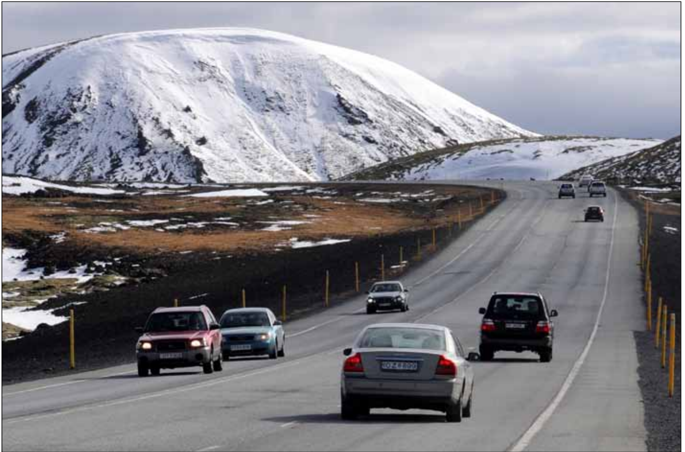
Hringvegur (1) í Hveradalabrekku. Vesturmörk útböðs sem auglýst er í þessu bláði. Sjá auglýsingu og yfirlitsmynd á bls. 6-7.

Hér er birt greinargerð um Álftanesveg sem vegamálastjóri og bæjarstjórinn í Garðabæ hafa skilað til innanríkisráðherra. Myndefni úr skipulagsuppráttum er sleppt hér ásamt hluta viðauka. Greinargerðina í heild má sjá á vegagerdin.is