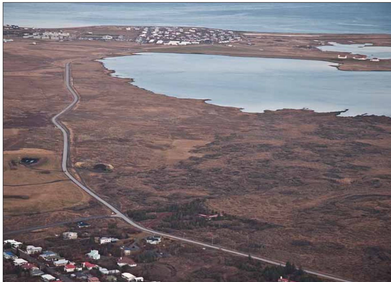
Álfanesvegur 20. október 2005. Síðan þá hefur Þrýðishverfið verið byggt norðan vegar neðst á myndinni og a.m.k. þrenn gatnamót bæst við.

Í matsskýrslunum er gert ráð fyrir að fjöldi íbúa á Garðaholti verði 5 - 7.000 og umferð árið 2024 verði 18 - 22.000 bílar á sólarhring. Möguleg breikkun vegarins og tengingar við aðliggjandi byggð er háð útfærslu á skipulagsáætlunum á öllum stigum.