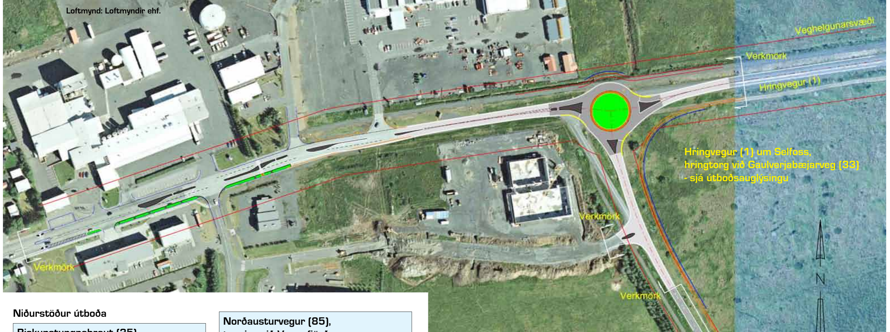
Hringvegur (1) um Selfoss, hringtorg við Gaulverjabæjarveg (33) - sjá útboðsauglýsingu