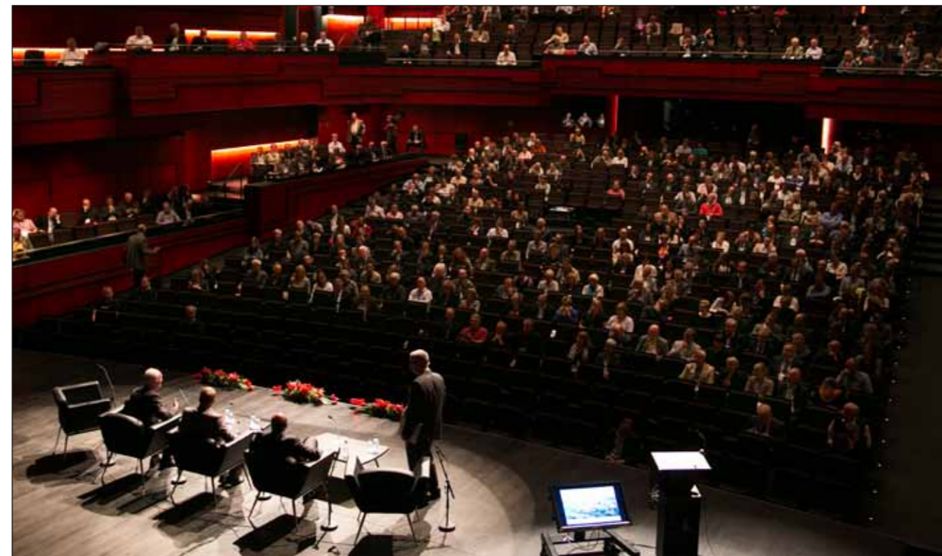
Plenum í Eldborg. Allir fjórir salir Hörpu voru notaðir fyrir Via Nordica ráðstefnuna.