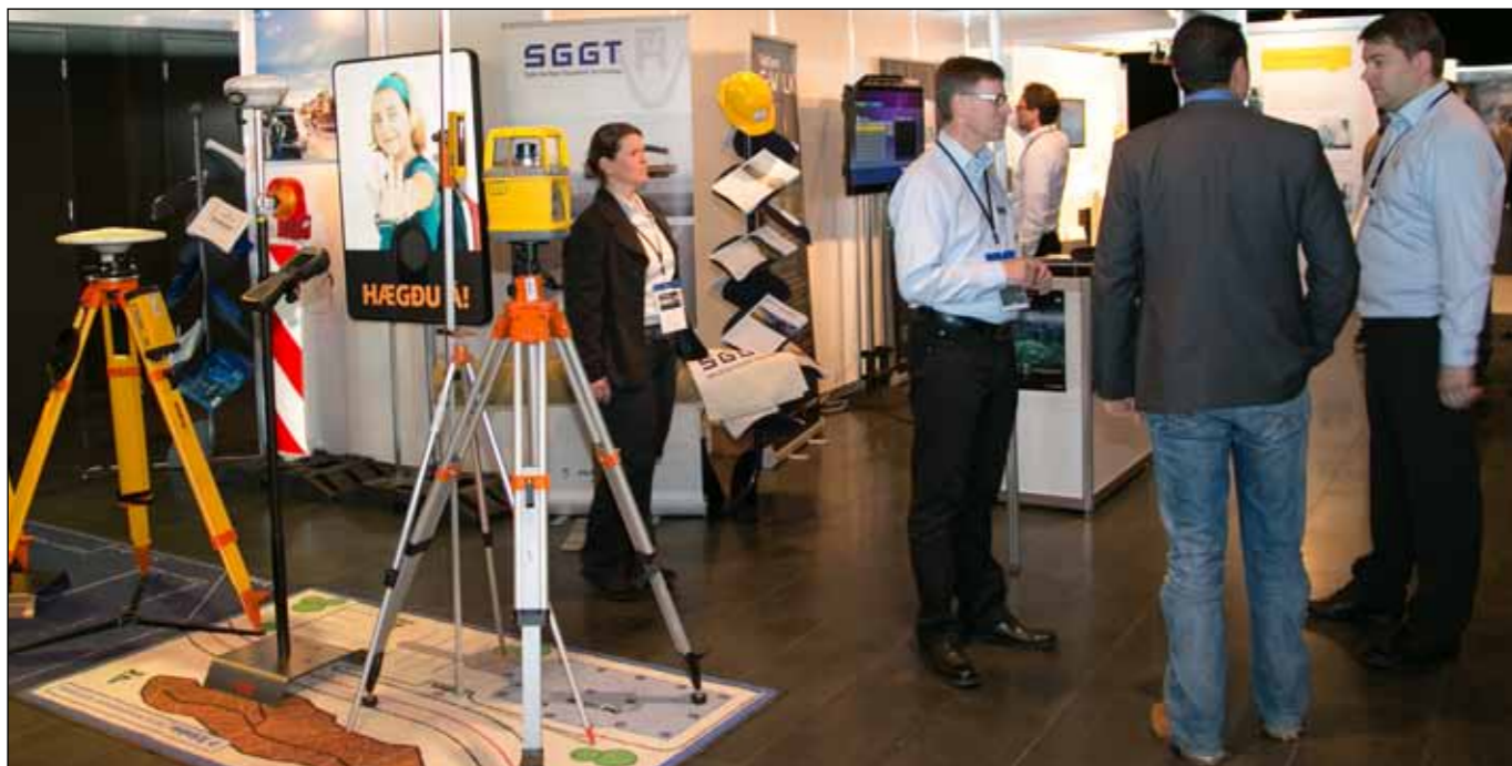
Einn af fjölmörgum básum í sýningarsvæði Hörpu.

hlaut þau. Hæfnisverðlaunin, eða Competenceprisen, fóru einnig til Noregs, til Næringslivsringsen en þau samtök einbeita sér að því að koma á sambandi milli norrænu ríkjanna um að ráða ungt fólk til starfa í tækni- og verkfræðigreinum.