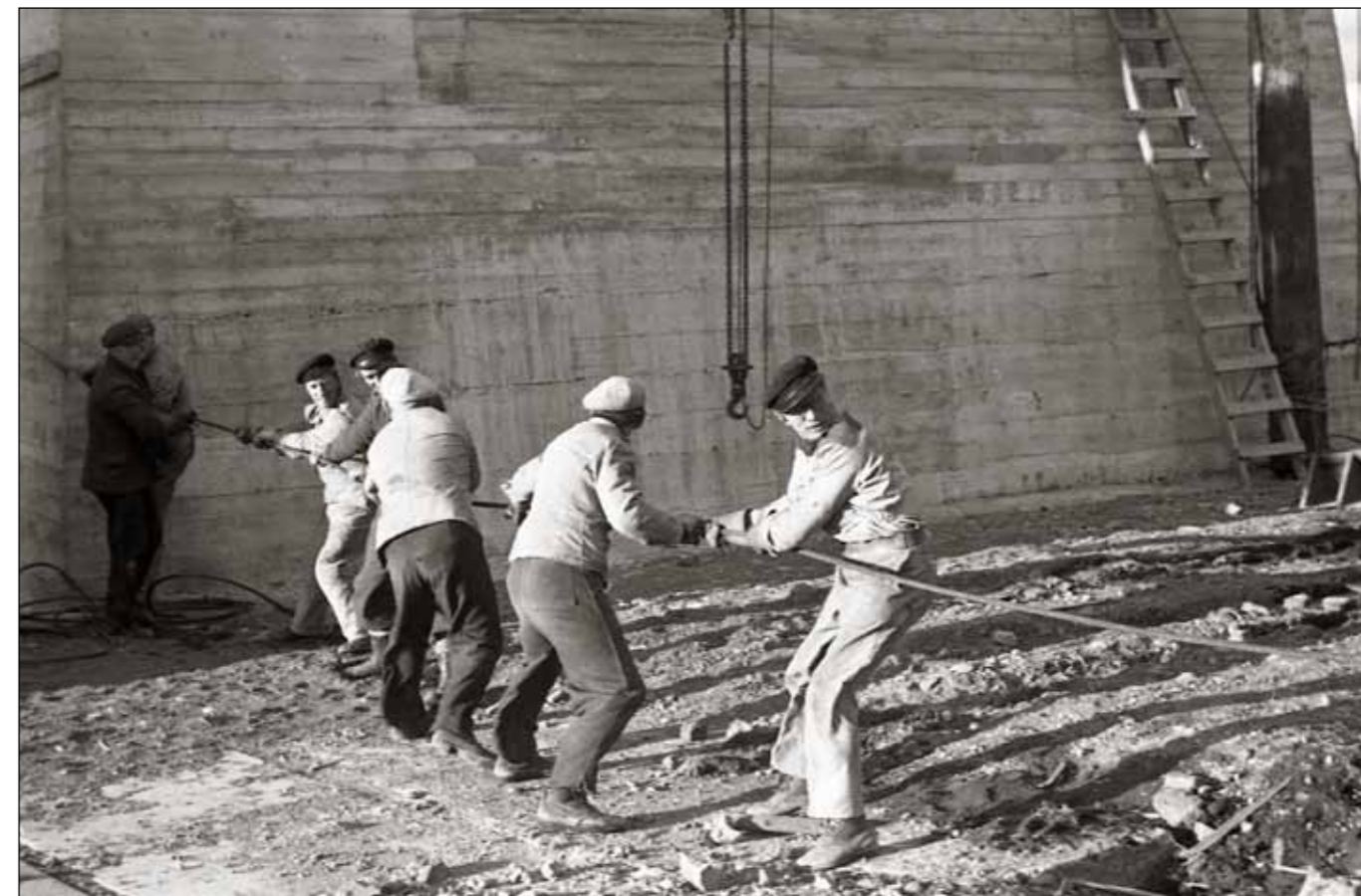
Brúarvinnu menn við Ölfusá 1945. Af öðrum myndum að dæma á þessari filmu eru mennirnir að fást við vír sem síðan hefur verið notaður til að draga burðarkaplana yfir. Það hefur örugglega verið gert með einhverkonar vélarafli því útilokað er að handflíð hafi ráði við það.

Kaplar í hengibrúm eru mikilvægar burðareiningar og getur brot í kapli jafnvel valdið hruni brúarinnar. Jafnframt eru þeir útsettir fyrir tæringu og viðkvæmir punktar eru gjarnan við