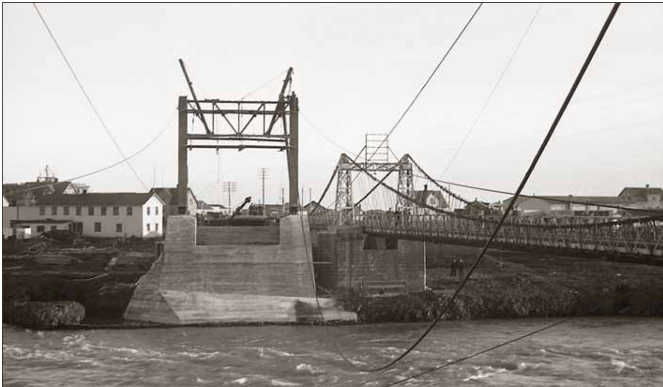
Ný hengibrú yfir Ölfusá í byggingu 1945. Burðarvírar dregnir yfir ána. Gamla hengibrúin til hliðar.