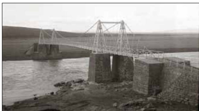
Fyrsta hengibrúin sem var yfir Jökulsá í Axarfirði.