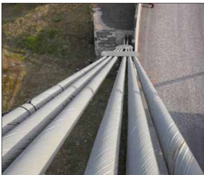
Kapall í Ölfusárbrú, 6 aðskildir strengir.