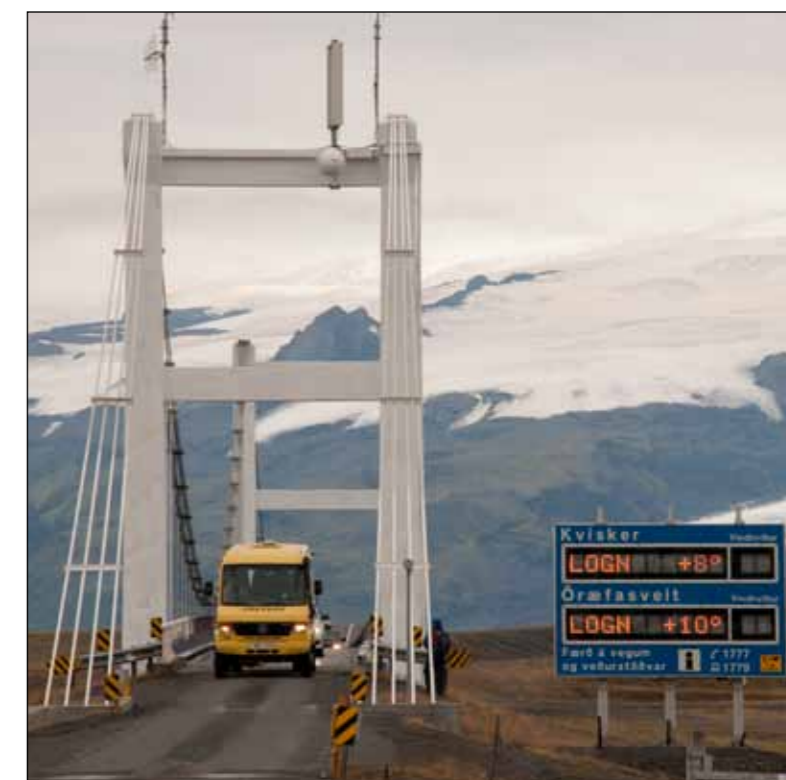
Jökulsá á Breiðamerkursandi.

Aðrar aðferðir. Samspil titringsmælinga, færslumælinga, og streitumælinga í ákveðnum burðarhlutum geta gefið góðar upplýsingar um hegðun brúarinnar sem verið er að vakta.