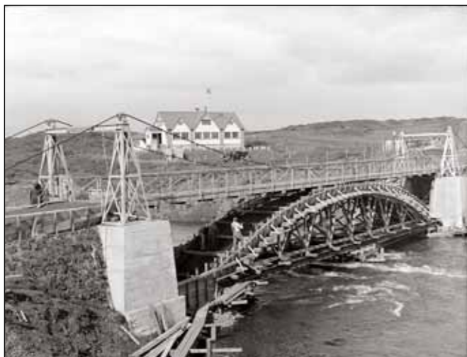
Hengibrúin yfir Sogið hjá Þrastarlundi var of burðarlítill þegar byrjað var að virkja Sogið. Bogabrá var byggð yfir ána en notast við hengibrúna á meðan.