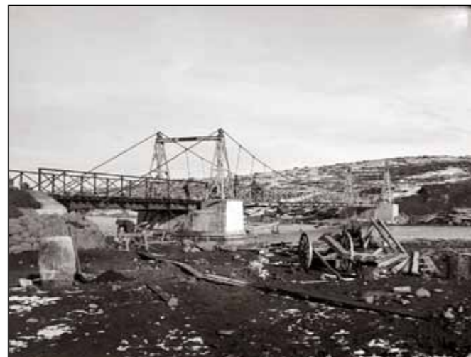
Hengibrúin yfir Sogið var flutt og sett upp á Kjalvegi yfir Hvítá hjá Bláfelli.