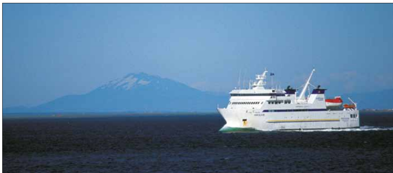
Hekla og ms. Herjólfur. Í þessu blaði er auglýst útboð á rekstri Vestmannaeyjaferjunnar árin 2012-2014.

Ekki hefur verið skrifað undir neina samninga frá því síðasta tölublað kom út