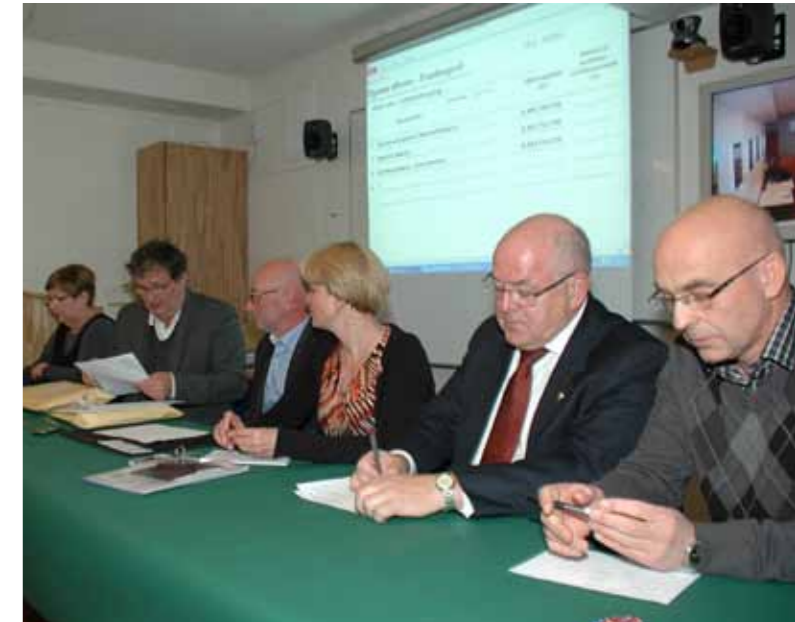
Frá opnun tilboða í Vaðlaheiðargöng 11.10.2011.

Ekkert af framangreindu á við um Vaðlaheiðargöng nema það að verktakinn byggir göngin en fær fyrir það jafnóðum greiðslur samkvæmt einingarverðum tilboðs. Hann hannar ekki göngin, fjármagnar þau ekki, rekur þau ekki og tekur ekki fjárhagslega áhættu af þeim á neinn hátt umfram það sem felst í tilboði hans. ■