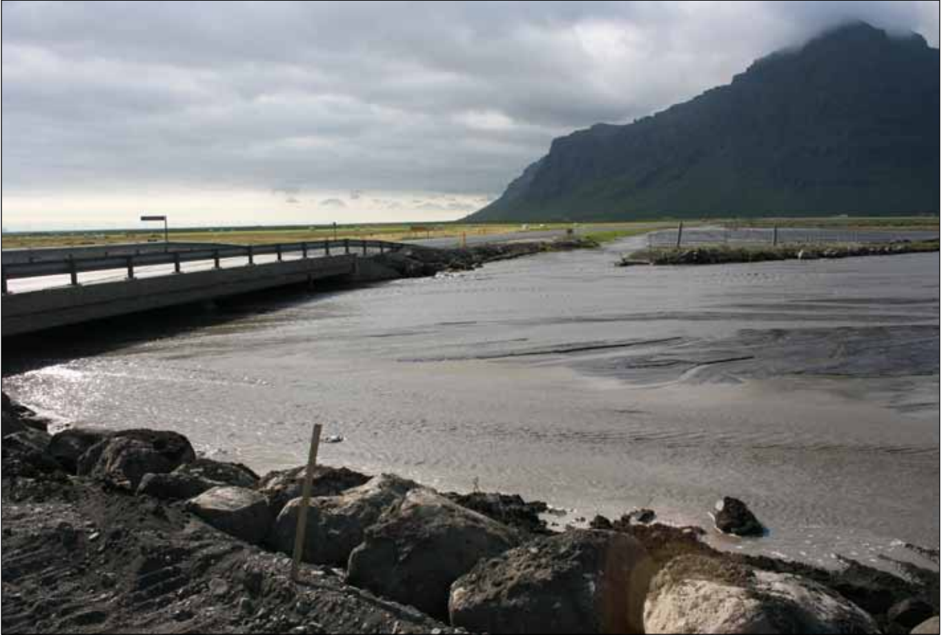
Hringvegur (1), brú á Svaðbælisá. Framburður fyllir árfarveginn.