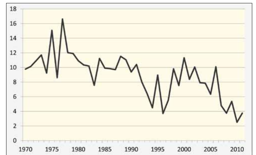
Banaslys á hverja 100 þúsund íbúa 1970-2011.