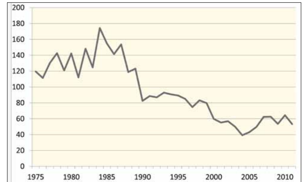
Alvarlega slysaðir á hverja 100 þúsund íbúa í umferðinni 1975-2011.