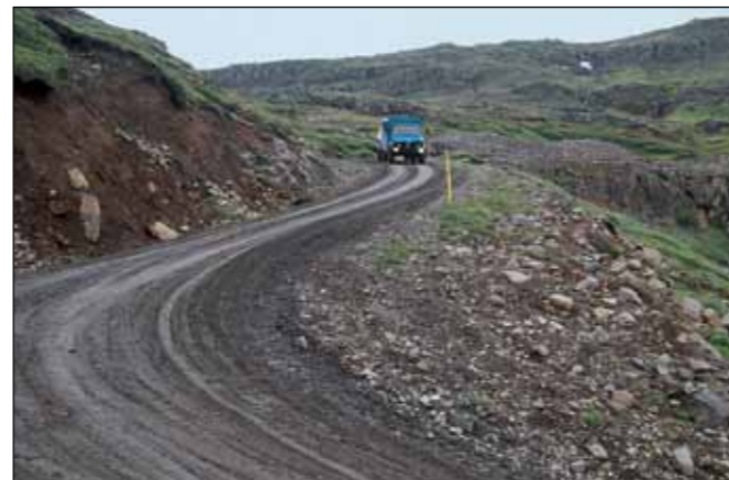
Mjóafjarðarvegur (953), tengivegur.