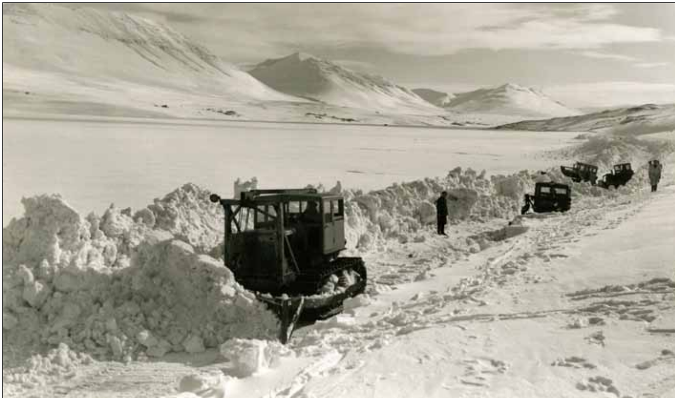
Eyjafjardarbraut undan Gili í apríl 1951. Í ófærðinni í vetur er holt að rifja upp aðstæður fólks um miðja síðustu öld.