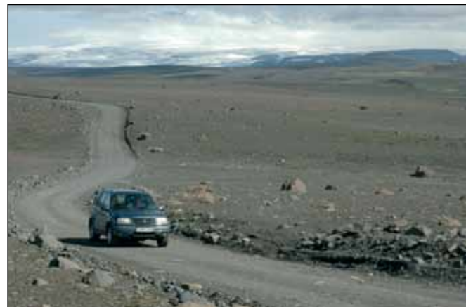
Kjalvegur (35), stofnvegur um hátendi.