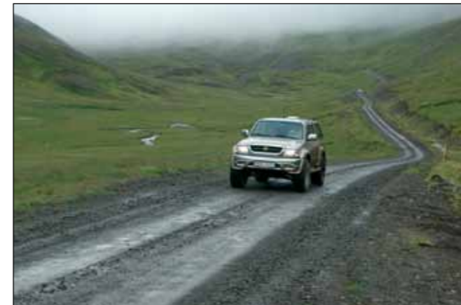
Ingjaldssandsvegur (624), héraðsvegur.