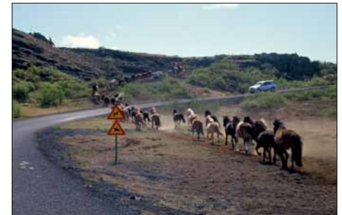
Reiðvegur við Kaldadalsveg (550) hjá Bolabás.