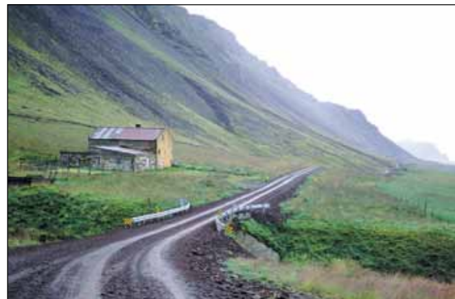
Klofningsvegur (590), tengivegur.