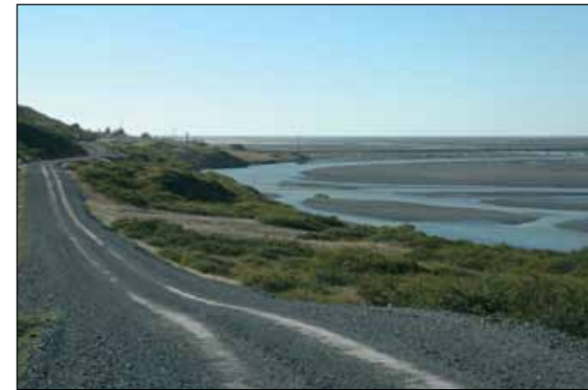
Vegur að Grænuhlíð í Lóni, héraðsvegur.

Landsvegir eru vegir yfir fjöll og heiðar sem ekki tilheyra neinum af framangreindum vegflokkum og aflagðir byggðavegir á eyðilendum. Á vegum þessum skal yfirleitt einungis gera ráð fyrir árstíðabundinni umferð og minna eftirliti og minni þjónustu en á öðrum þjóðvegum.