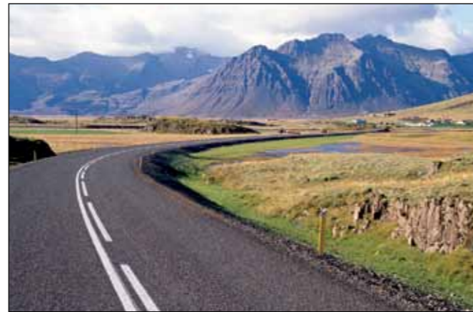
Hringvegur (1) í Suðursveit, stofnvegur.