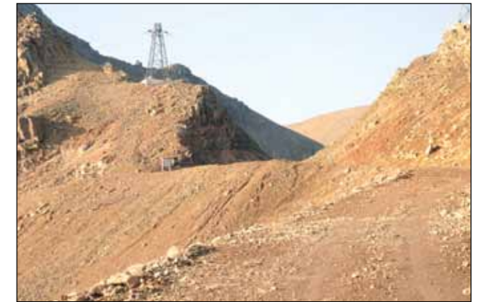
Skarðsvegur (793) Siglufjarðarskarð, landsvegur.