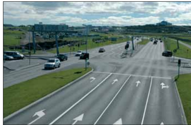
Nesbraut (49) í Reykjavík (Hringbraut), stofnvegur.

Tengivegir eru vegir utan þéttbýlis sem liggja af stofnvegi á stofnveg eða af stofnvegi á tengiveg og eru a.m.k. 10 km langir, vegir sem tengja landsvegi við stofnvegi, vegir sem ná til þéttbýlisstaða með færri en 100 íbúa og tengja þá við stofnvegakerfið, vegir að helstu flugvöllum og höfnum sem mikilvægar eru fyrir flutninga og ferðaþjónustu, og vegir að ferjuhöfnum ef þeir eru ekki stofnvegir, vegir að þjóðgördum og innan þeirra og vegir að fjölsóttum ferðamannastöðum utan þéttbýlis. Þar sem tengivegur endar í þéttbýli skal tengja hann fyrstu þvergötu sem tilheyrir vegakerfi þéttbýlisins og enda þar.