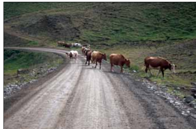
Eyjaafjarðarbraut vestri (821), tengivegur.