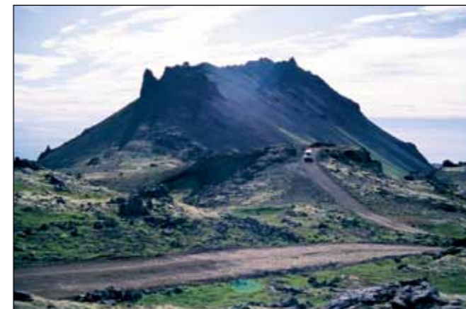
Jökulhálsleið (570), landsvegur.