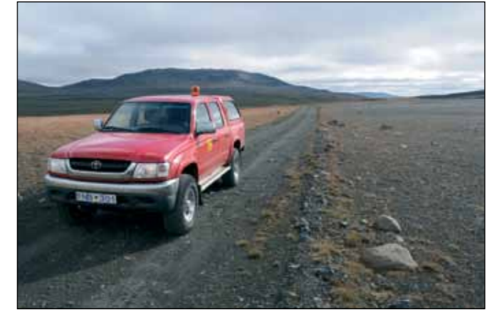
Brúarvegur (907), landsvegur.