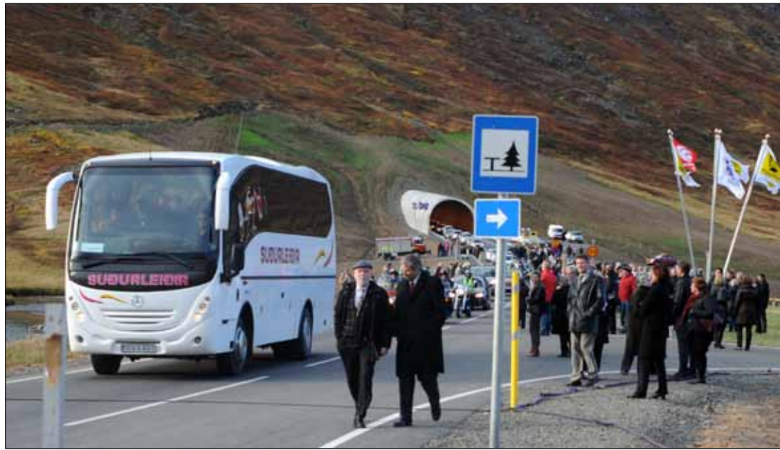
Umferð um Héðinsfjarðargöng á vígsludegi 2. október 2010.

Á meðfylgjandi línuriti má sjá hvernig meðalumferð um Héðinsfjarðargöng hefur þróast, það sem af er ári. ■