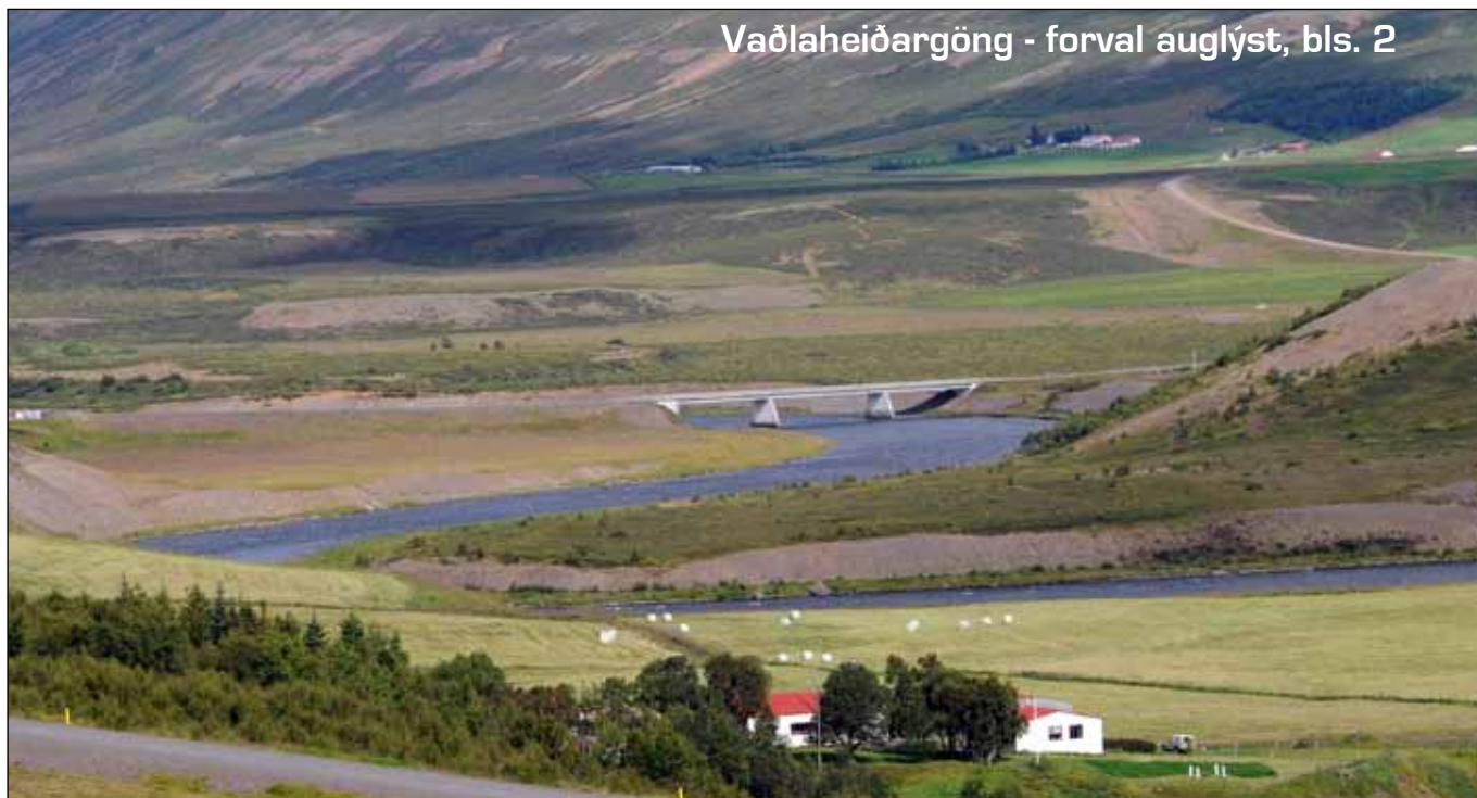
Vaðlaheiðargöng - forval auglýst, bls. 2

Eitthvað þessu líkt verður útsýnið þegar komið verður út úr Vaðlaheiðargöngum í Fnjóskadal síðsumars í framtíðinni.