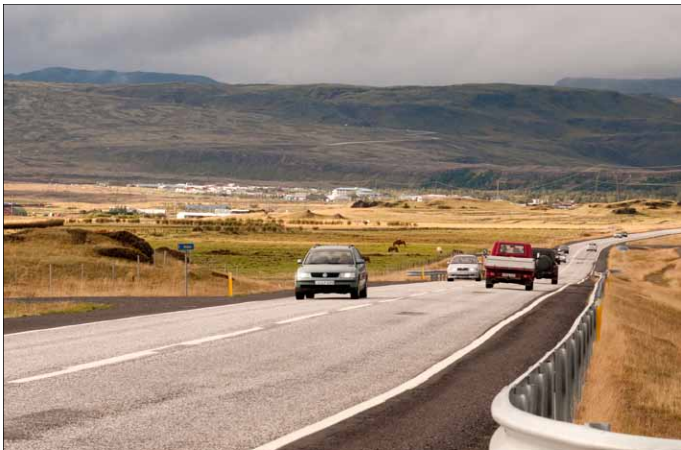
Hringvegur (1), Suðurlandsvegur, á milli Hveragerðis og Selfoss er sérlega varasamur vegna fjölda hliðarvega og umferðar sem er bæði mikil og hröð.