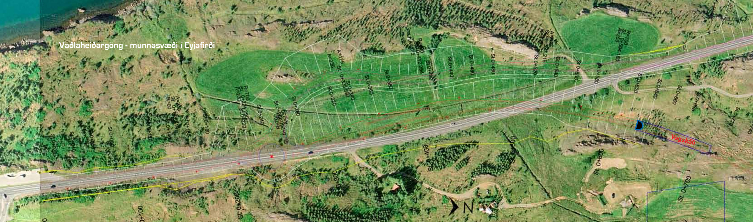
Vaðlaheiðargöng - munnasvæði í Eyjafirði