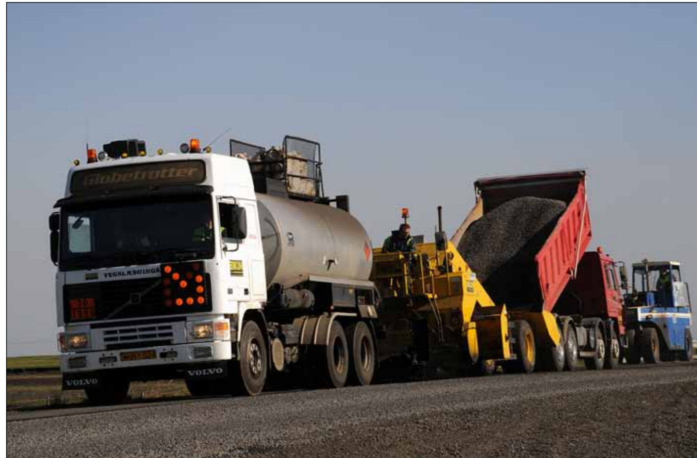
Í þessu blaði er auglýst útboð yfirlagna klæðinga á Norðvestursvæði.