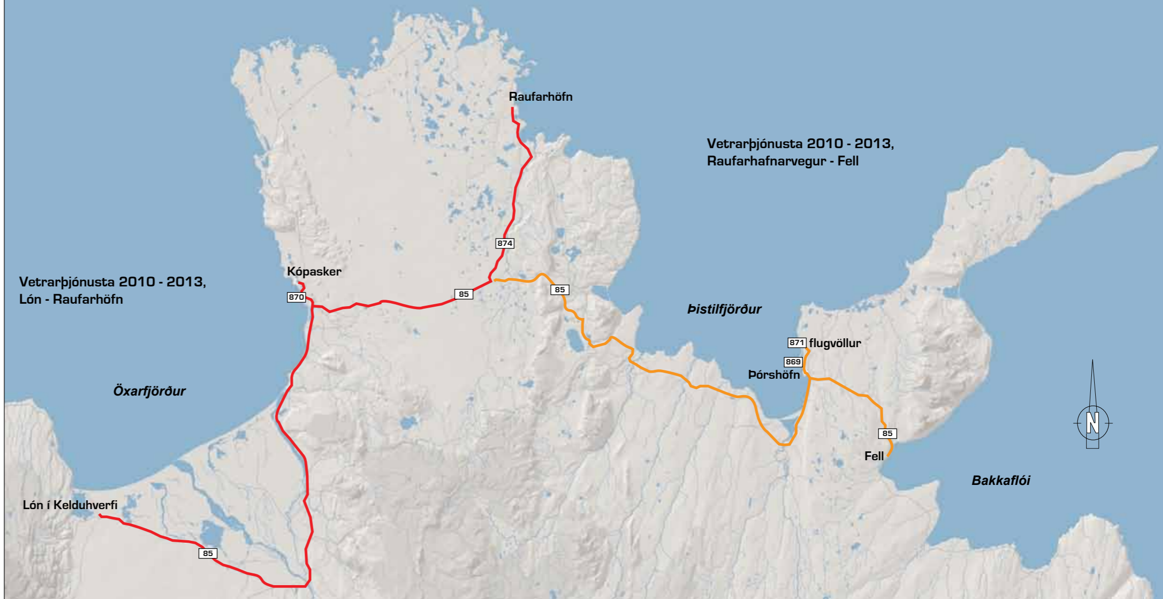
Vetrarþjónusta 2010 - 2013, Lón - Raufarhöfn

Skila skal tilboðum á sömu stöðum fyrir kl. 14:00 þriðjudaginn 7. september 2010 og verða þau opnuð þar kl. 14:15 þann dag.