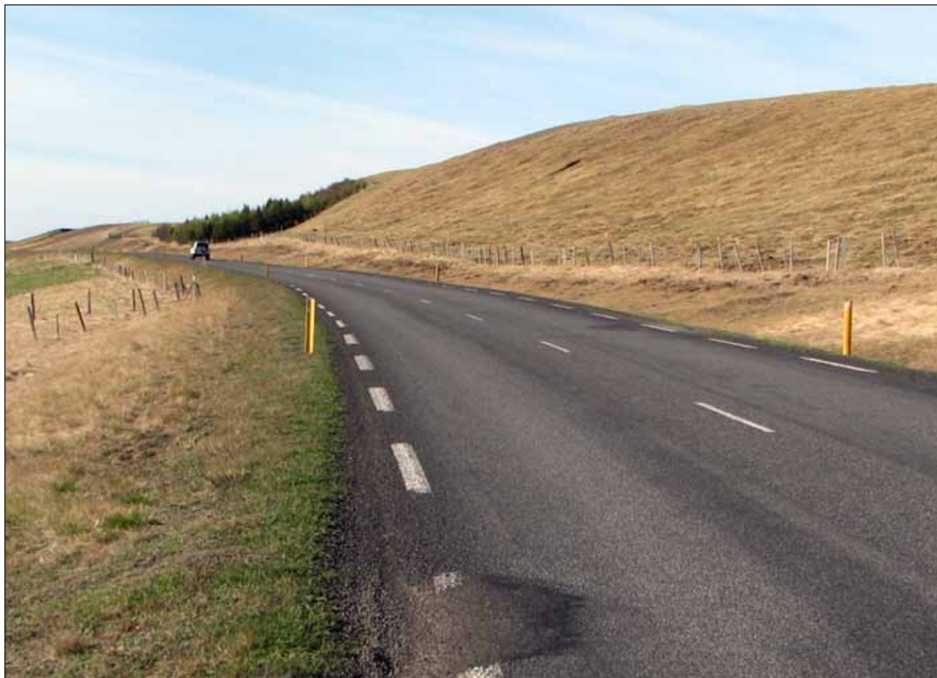
Hringvegur (1), Hnausakvísl - Stóra Giljá. Útboð endurbóta á þessum vegi er auglýst í þessu blaði. Þessi framkvæmd verður kynnt nánar í næsta blaði.