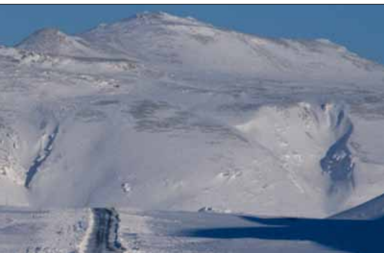
Í þessu blaði eru auglýst 9 útboð vetrarþjónustu víðsvegar um landið.

Pá er það einnig í fyrsta sinn í 75 ára sögu sambandsins sem Ísland leiðir starfið og er Hreinn Haraldsson vegamálastjóri formaður NVF á tímabilinu 2008 – 2012. Og þar af leiðandi einnig fulltrúi allra Norrænu ríkjanna á vettvangi alþjóðasambandsins PIARC.