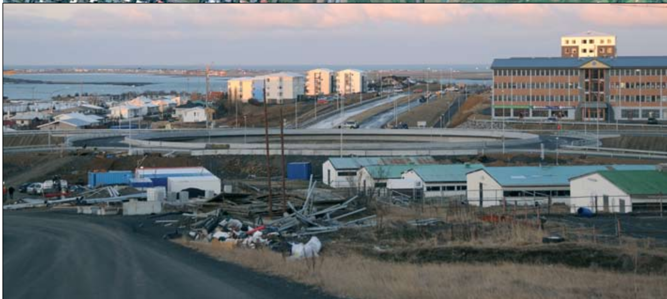
Mislæg gatnamót Reykjanesbrautar og Arnarnesvegur, hringtorg, voru tekin í notkun 29. nóvember sl. Nýr vegur liggur yfir þetta svæði meðfram hesthúsum.