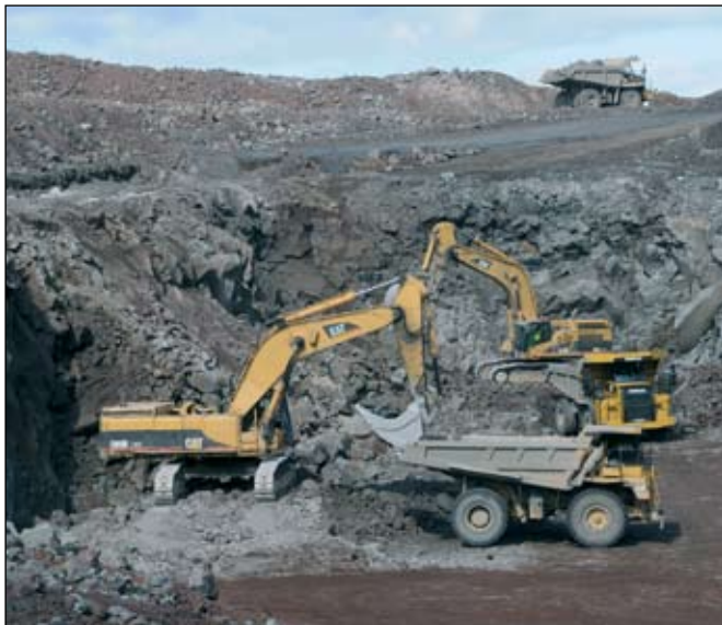
Bakkafjöruhöfn. Náma á Seljalandsheiði. Áætlað magn af grjóti fyrir varnargarða er um 700.000 m 3 .