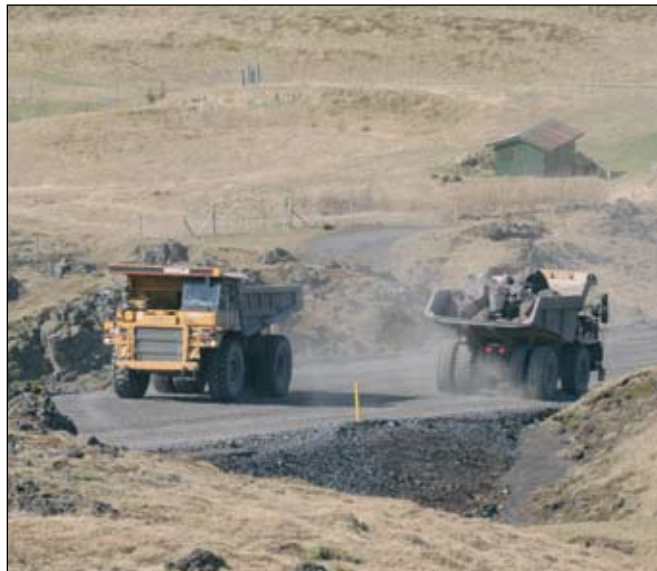
Grjótmagn svarar til 27 – 28.000 ferða fyrir námubíla. Verktaki er Suðurverk.