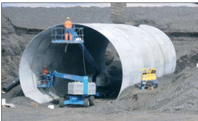
Mislæg gatnamót. Nú er unnið við þverun á þjóðvegi nr. 1 vestan við Markarfljótsbrú. Búið er að gera hjáleið og grafa sundur veginn. Þar hefur verið komið fyrir stóru röri en námubílar munu geta farið í gegnum það og undir þjóðveginn með grjót í varnargarða.