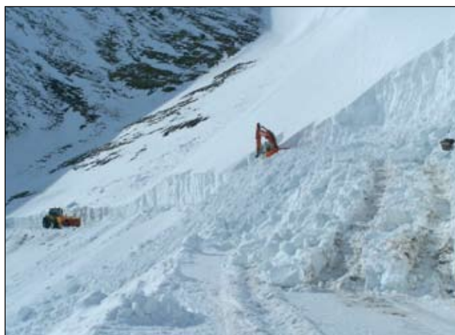
Þann 14. apríl var aftur haldið á heiðina og þá voru aðstæður skaplegri. Skófla krakaði verstu skaflana niður.