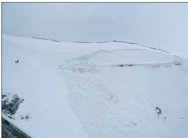
Þetta var verkefnið sem beið Vegagerðarmanna þegar þeir reyndu að opna Hrafnseyrarheiðina þann 6. apríl sl. Nýlega fallið snjóflóð og meira væntanlegt. Til vinstri á myndinni má sjá menn að koma fyrir sprengjuhleðslu.