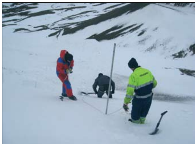
Reynt var að sprengja niður hættulegustu hengjuna en það tókst ekki nógu vel og urðu snjóruðningsmenn frá að hverfa þennan dag.