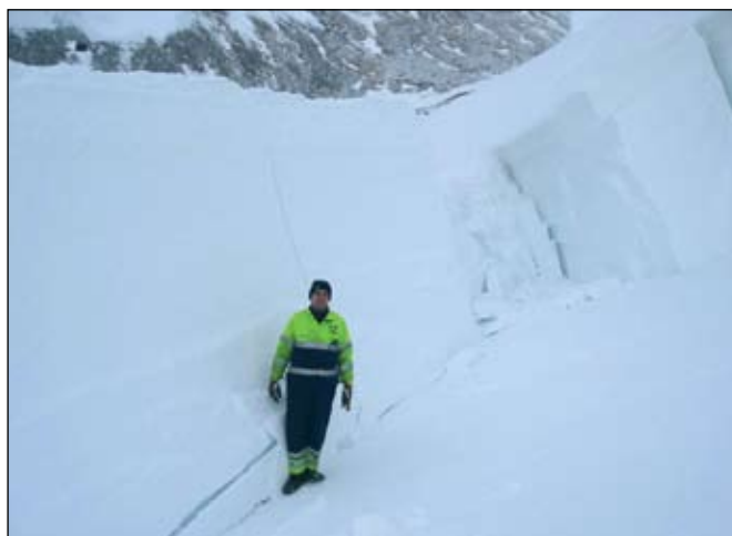
Snjóflekarnir sem þarna myndast eru ekki smáir.