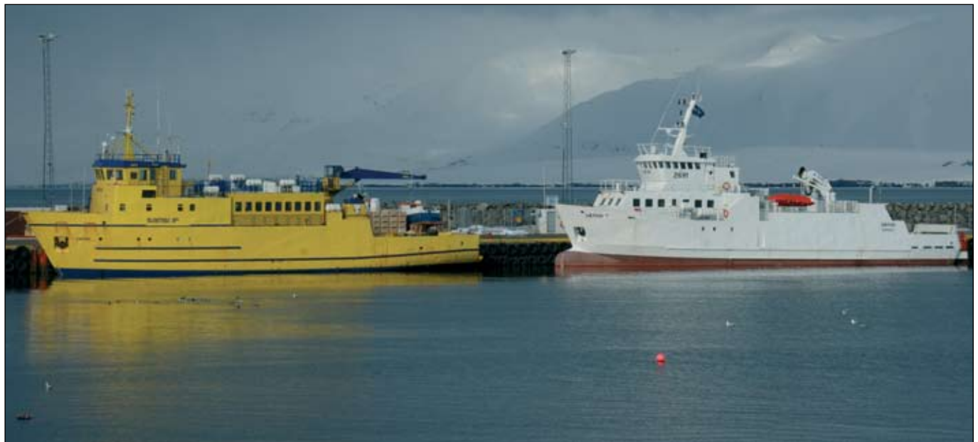
Tveir Sæfarar við bryggju á Dalvík.