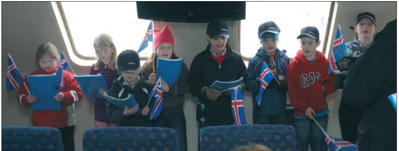
Skólabörn í Grímsey sungu frumsamið ljóð fyrir gesti og heimafólk um borð í nýjum Sæfara.