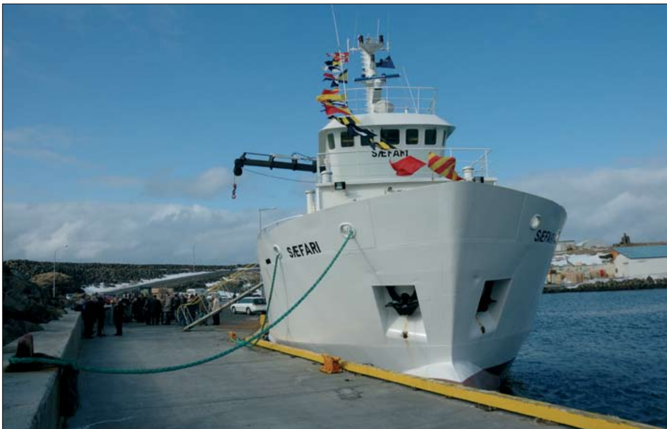
Sæfari við bryggju í Grímsey.