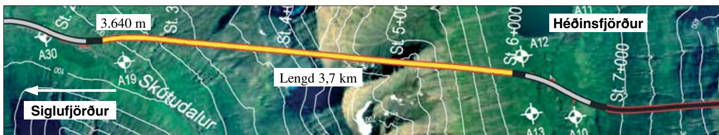
Staða framkvæmda við Héðinsfjarðargöng 14. apríl. 2008. Búið er að sprengja 3.640 m í Siglufirði og 2.822 m í Ólafsfirði.