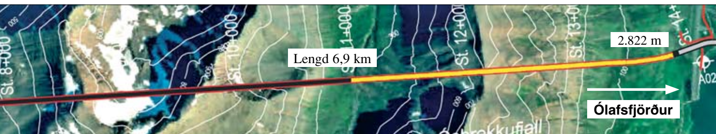
Samtals er búið að sprengja 6.462 m sem er 61,1 % af heildarlengd.

Í viku 15 gekk gekk gangagröftur bærilega Ólafsfjarðarmegin og sprengdir voru 54 m. Lengd ganga þeim megin frá er nú 2.822 m. Siglufjarðarmegin var unnið við undirbúning gangagraftar frá Héðinsfirði til Ólafsfjarðar. Einnig var unnið við endanlegar styrkingar í göngum milli Siglufjarðar og Héðinsfjarðar. Samtals er nú búið að sprengja 6.462 m eða um 61,1% af heildarlengd.