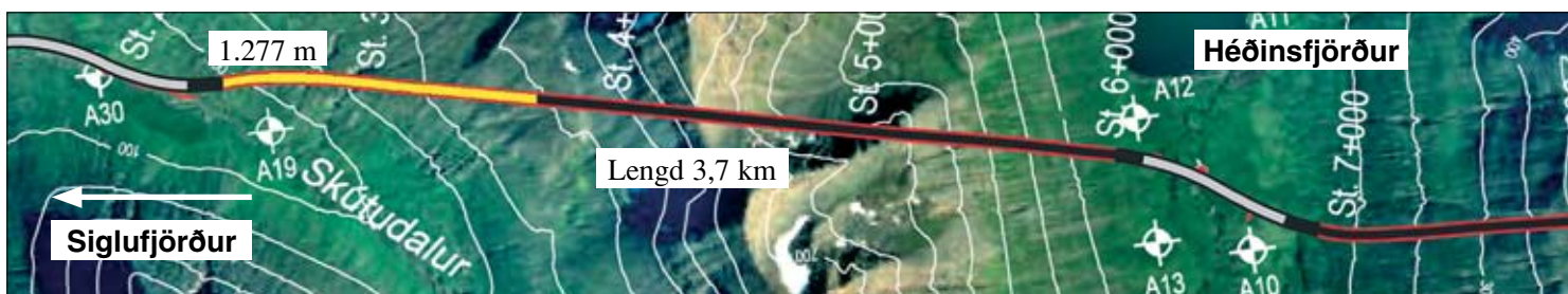
Staða framkvæmda við Héðinsfjarðargöng 9. apríl 2007. Búið er að sprengja 1.277 m í Siglufirði og 1.139 m í Ólafsfirði.