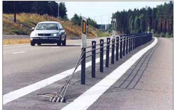
Víravegrið á 2+1 vegi.