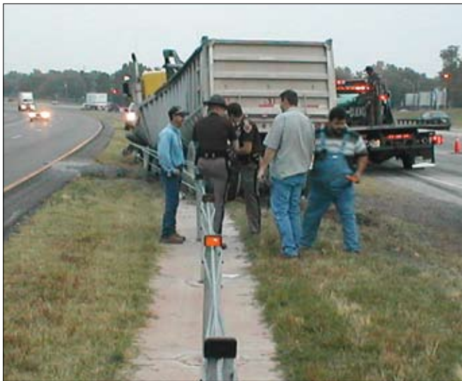
Vírarnir geta stöðvað stærstu bíla.