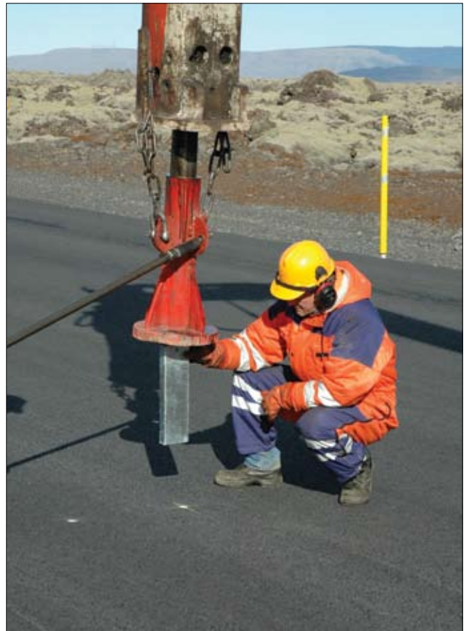
Spelar fyrir víravegrið reknir niður í Svínahrauni.

Það er mjög mikilvægt að þessi tilraun í Svínahrauni takist vel og öikumenn verði fljótir að tileinka sér rétt aksturslag á svona vegi. Hugsanlega geta orðið fleiri óhöpp á þessum vegarkafli en áður ef bílar lenda utan í vegriðinu vegna hálfu eða af öðrum orsökum. Það getur kostað einhverjar skemmdir á ökutækjum en ávinningurinn af færri slysum með meiðslum á að borga það margfalt upp.