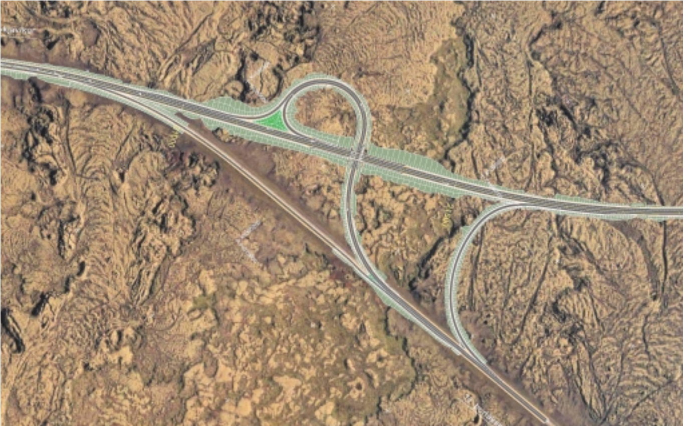
Mynd að ofan: Mislæg gatnamót Hringvegjar og Þrengslavegar með aðliggjandi tengingum. Mynd að neðan: Yfirlit framkvæmdasvæðis frá Litlu-kaffistofunni að Hveradalabrekku.