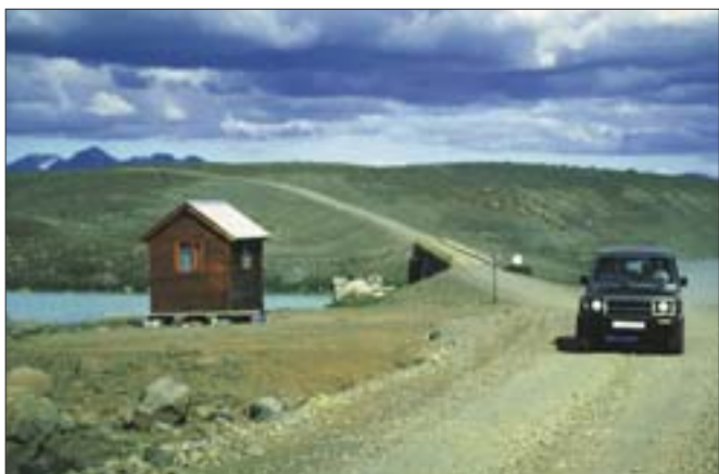
Kjalvegur (35) við Hvítá, landsvegur.