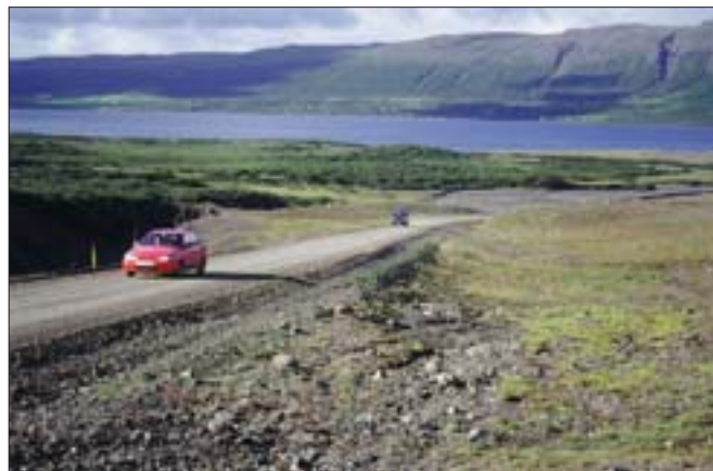
Dragvegur (520) í Skorradal, tengivegur.

Skila skal tilboðum á sömu stöðum fyrir kl. 14:00 þriðjudaginn 20. apríl 2004 og verða þau opnuð þar kl. 14:15 þann dag.