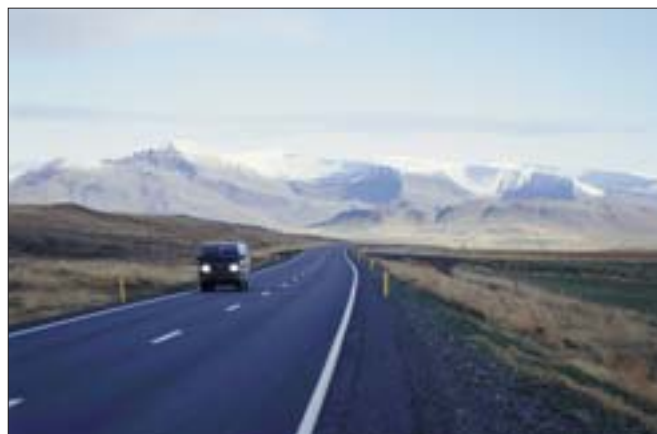
Hringvegur (1) við Grundartanga, stofnvegur.