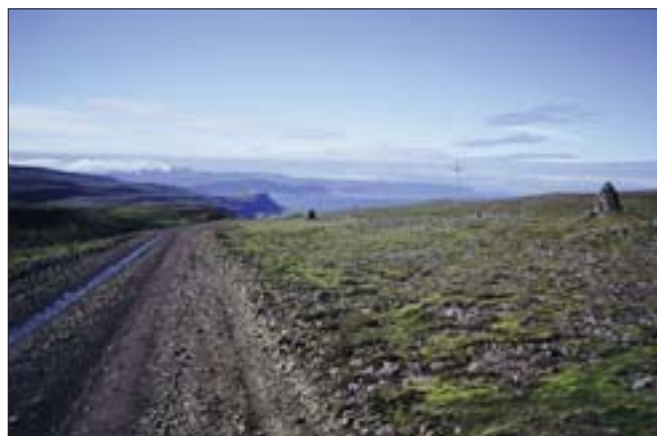
Tröllatunguvegur (605) séð til Breiðafjarðar, landsvegur.