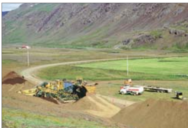
Í þessu blaði eru birtar niðurstöður útboðs efnisvinnslu á Vestfjörðum og auglýst útboð efnisvinnslu á Suðursvæði. Myndin sýnir efnisvinnslu hjá Vestfjarðavegi (60) í Djúpadal í ágúst 1994.

Skila skal tilboðum á sömu stöðum fyrir kl. 14:00 þriðjudaginn 20. apríl 2004 og verða þau opnuð þar kl. 14:15 þann dag.