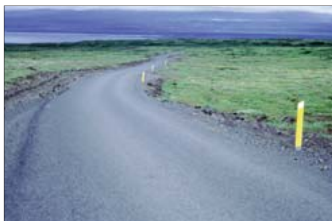
Gjábakkavegur (365), stofnvegur.