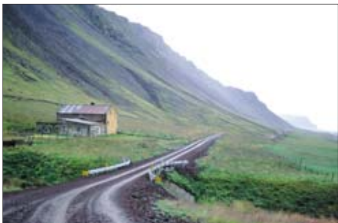
Klofningsvegur (590), tengivegur.