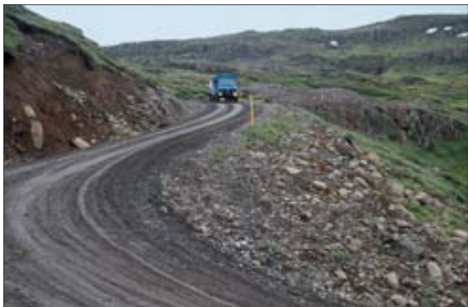
Mjóafjarðarvegur (953), tengivegur.