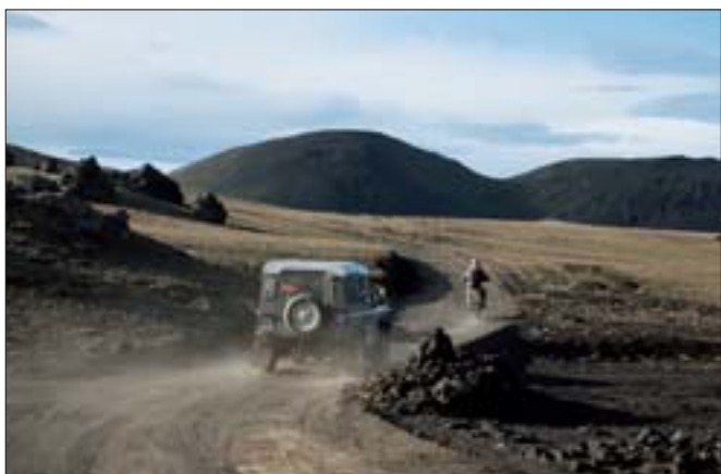
Landmannaleið (F225), landsvegur.