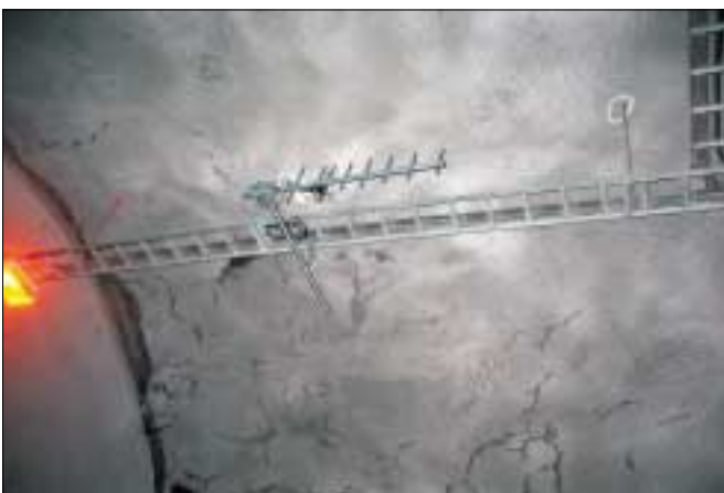
TETRA-loftnet í Breiðadals- og Botnsheiðagöngum.

Vinna við að setja upp TETRA fjarskiptakerfi í göngin undir Breiðadals- og Botnsheiði er nú langt komin. Undirbúningur hefur staðið yfir lengi en í júní 2002 var lögð fram skýrsla um mælingar á drægni fjarskiptakerfa í göngunum. Bæði voru gerðar mælingar á GSM síma og TETRA. Valið var að setja upp TETRA kerfi og var helsta ástæðan sú að símakerfi er ekki talið nothæft fyrir björgunaraðila í neyðartilvikum því það teppist við of mikið álag. Í þessu sambandi má geta þess að samið var um uppsetningu TETRA kerfis í Hvalfjarðargöng á sama tíma og er nýbúið að setja það upp.