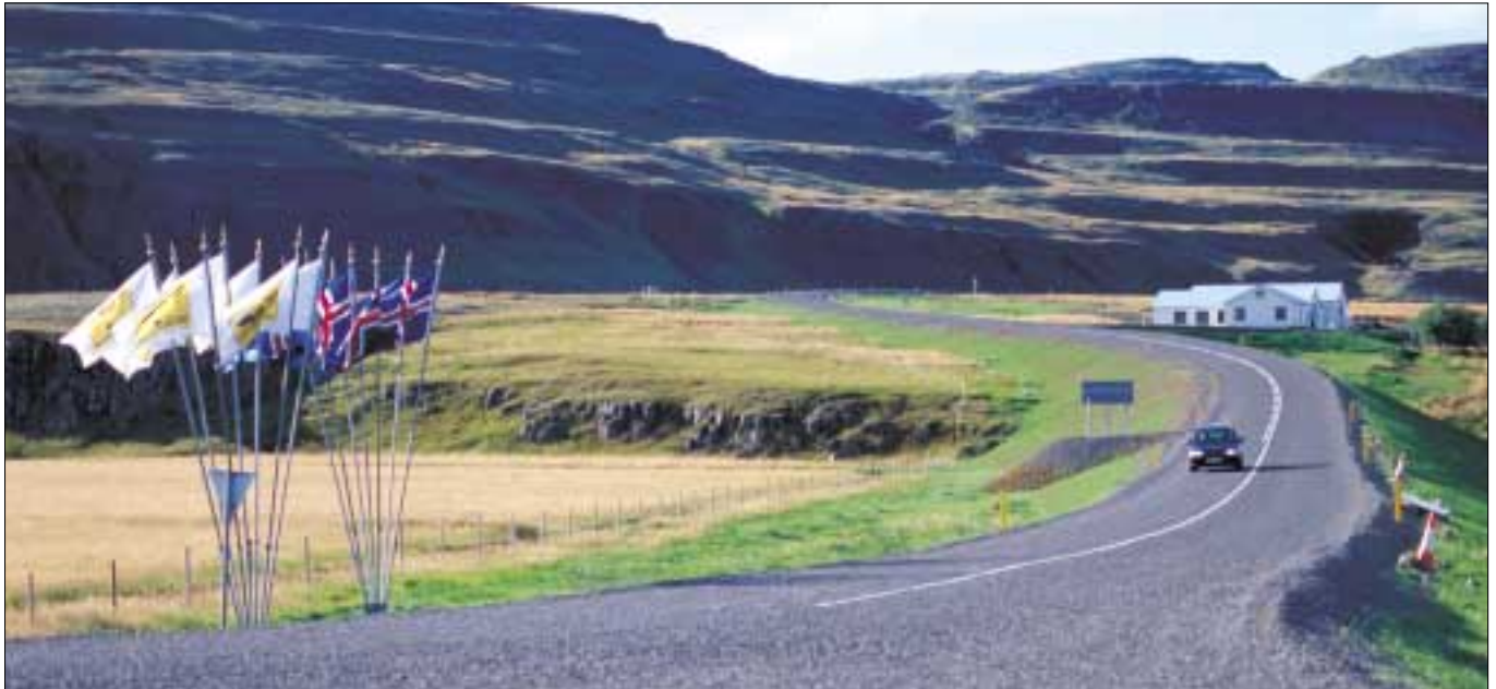
Vestfjarðavegur (60) við Dalsmynni, gatnamót við Hringveg (1). Fánar uppi í tilefni vígslu nýs vegar um Bröttubrekk, föstudaginn 26. ágúst 2003.