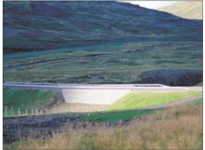
Há vegfylling yfir ræsi á Bjarnardalsá.

Opnun nýs heilsársvegar yfir Bröttubrekku bætir því samgöngur á svæðinu mikið. Vegurinn í gegnum Dalasýslu er jafnframt þjóðbraut á sunnanverða Vestfirði. Með tilkomu Gilsfjarðarbrúar hefur umferð af norðanverðum Vestfjörðum aukist mikið yfir sumartímann enda er sú leið mun styttri en leiðin yfir Steingrímsfjarðarheiði. Þessi nýi vegur er því einnig mikil samgöngubót fyrir Vestfirðinga.