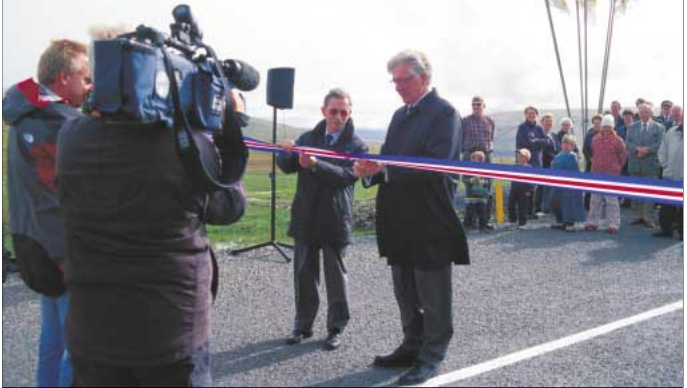
Vígsla nýs vegar um Bröttubrekku föstudaginn 26. ágúst 2003. Sturla Böðvarsson samgönguráðherra klippir á borða. Jón Rögnvaldsson vegamálastjóri aðstoðar.

Föstudaginn 26. ágúst 2003 var nýr vegur um Bröttubrekku formlega tekinn í notkun. Sturla Böðvarsson samgönguráðherra klippti á borða með aðstoð Jóns Rögnvaldssonar vegamálastjóra.