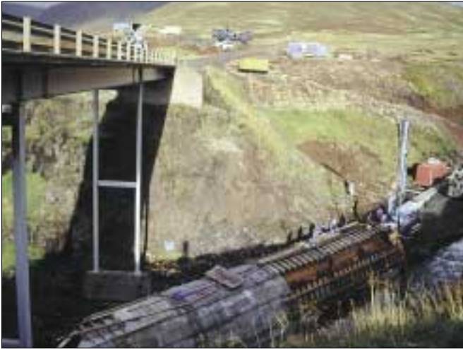
Ræsi í Bjarnardalsá í byggingu í september 2002.