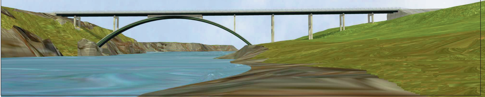
Ný brú yfir Þjórsá sem nú er í byggingu.

Tillaga til þingsályktunar um samgönguáætlun fyrir árin 2003 til 2014 hefur verið lögð fyrir Alþingi og er gert ráð fyrir að hún verði afgreidd á næstunni. Hægt er að skoða þingskjalíð á vef Alþingis: http://www.althingi.is/altxt/128/s/0774.html