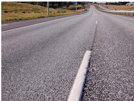
Mishæð í slitlagi, hættulegt bifhjólafólki

Í undirbúningsferli þessa verkefnis, þ.e. í maí 2009, var haldinn sameiginlegur fundur Sniglanna og Vegagerðarinnar um sjónarmið bifhjólamanna varðandi umferðaröryggismál. Sýndar voru myndir af vegakerfinu og þeim augljósu hættum sem blasa við bifhjólamönnum er eru kannski ekki eins augljósar fyrir öikumönnum bíla. Gagnkvæmur skilningur er mikilvægur ef ná á einhverjum árangri.