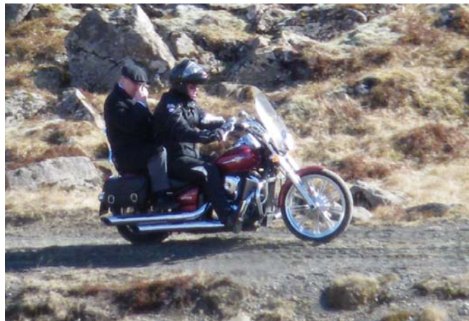
Fyrirverandi samgönguráðherra í takt við nýja tíma.

Með verkefni þessu er vonast til þess að samstarf bifhjólamanna við veghaldara, hönnuði vega og gatna og þeirra sem nota götur og vegi aukist og bifhjólum verði veitt meiri athygli, bæði í hönnun og rekstri samgöngumannvirkja. Það er ljóst að bifhjólum á eftir að fjölga enn meira og því er mikilvægt að allir leggist á eitt um að stuðla að öruggari umferð, ekki bara bílaumferð, heldur líka umferð annarra vélknúinna ökutækja sem nota vegina.