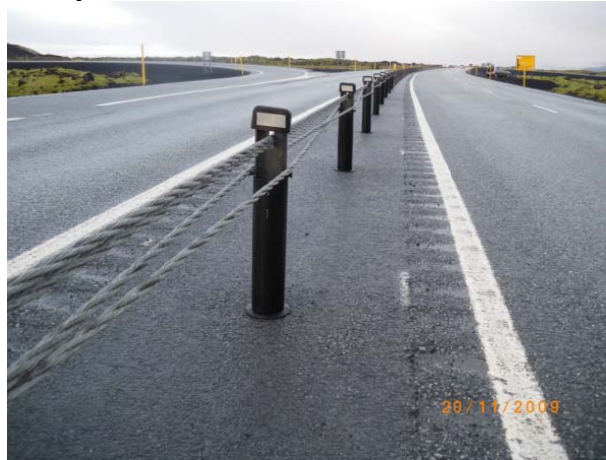
Plasthlíf á vegriðsstólpa

Þá er einnig fyrirhugað að gera rannsókn á svokölluðum stólpahlífum á vegriðsstólpa á hættulegum stöðum en ákeyrsla á stólpa og skilti er mjög algengur slysavaldur erlendis og dæmi eru til um slík slys hérlendis líka.