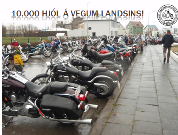
Frá hópkeyrslu Sniglanna sumardaginn fyrsta.

Undanfarin ár hefur fjöldi bifhjóla í almennri umferð aukist verulega og á eflaust eftir að aukast enn meira á næstu árum, ekki síst vegna hagkvæmnissjónarmiða í kjölfar hækkandi eldsneytisverðs og hinnar alræmdu kreppu og einnig vegna aukinnar notkunar yngra fólks á vespum og léttum bifhjólum.