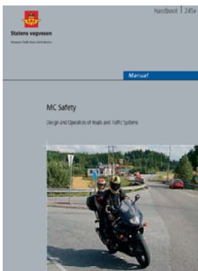
Håndbok 245, MC-sikkerhet, veiledning.

Undirbúningur áróðurs er hafinn fyrir bættu bifhjólamenningu, fræðsla fyrir byrjendur, upprifjun fyrir eldri bifhjólamenn. Útgáfa fræðsluefnis og þátttaka í mótun reglugerða og laga um umferðaröryggismál eru meðal baráttumála Sniglanna. Þá er rétt að geta þess að Norska vegagerðin er mjög virk á þessu sviði og hefur gefið út mikið af efni sem stefnt er á að gefa út með tilliti til íslenskra aðstæðna. Má þar nefna Håndbok 245, MC-sikkerhet, veiledning .