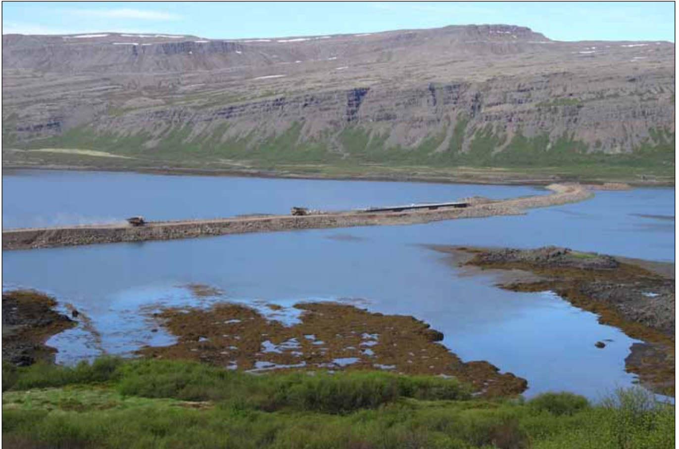
Vestfjarðavegur (60) í Kjálkafirði 5. júní 2014. Vegfylling er að verða fullbúin og brúin bíður þess að fylling í brúaropi verði fjarlægð og sjó verði veitt undir hana.