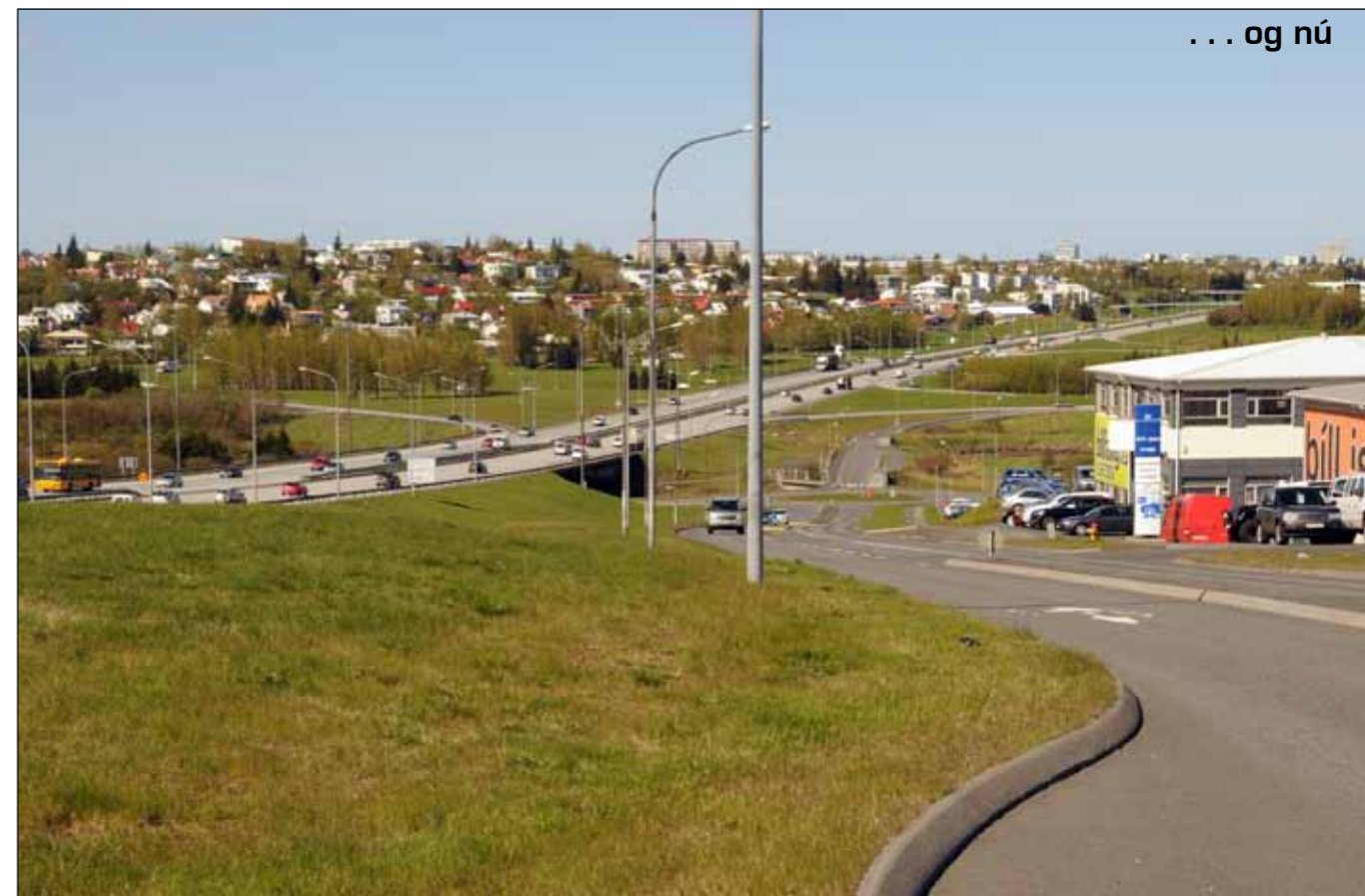
Sami staður í júní 2014. Á miðri mynd má enn sjá bút af veginum eins og hann var á gömlu myndinni. Sjónarhornið er víðara og lengra til hægri en á gömlu myndinni.