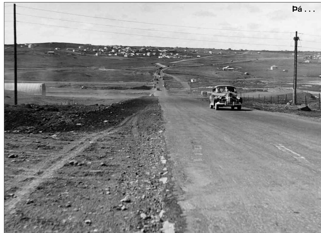
Ártúnsbrekka í Reykjavík. Þessi mynd er úr safni Jóns J. Víðis, ódagsett en líklega tekin um miðjan 6. áratug síðustu aldar.