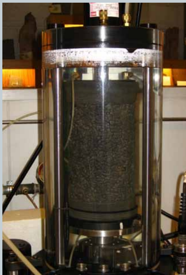
Burðarlagsýni í þrúas, tilbúið til prófunar.

er óbreyttur meðan á prófinu stendur en lóðrétt álagið er látið sveiflast. Þessi prófunaraðferð getur gefið upplýsingar