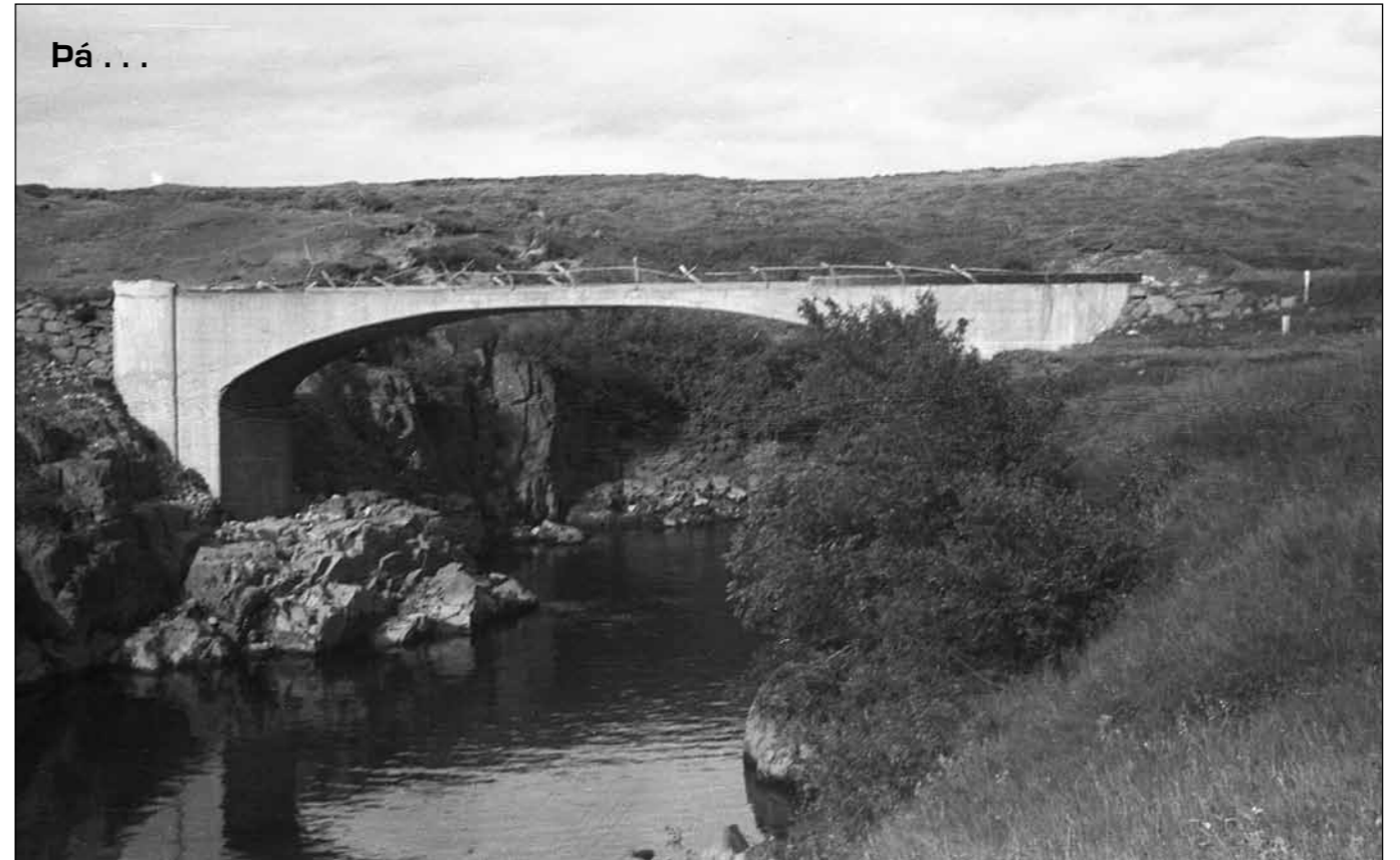
Brú á Eyvindará á Seyðisfjarðarvegi (93) við Egilsstaði, byggð 1919. Áður var trésperrubrú á ánni, líklega byggð 1879. Myndin er tekin árið 1947. Væntanlega hefur brúin verið full mjó fyrir herflutninga stríðsáranna og handriðið því lagt niður heldur ósnyrtilega.

Skila skal tilboðum á sömu stöðum fyrir kl. 14:00 þriðjudaginn 11. mars 2014 og verða þau opnuð þar kl. 14:15 þann dag.