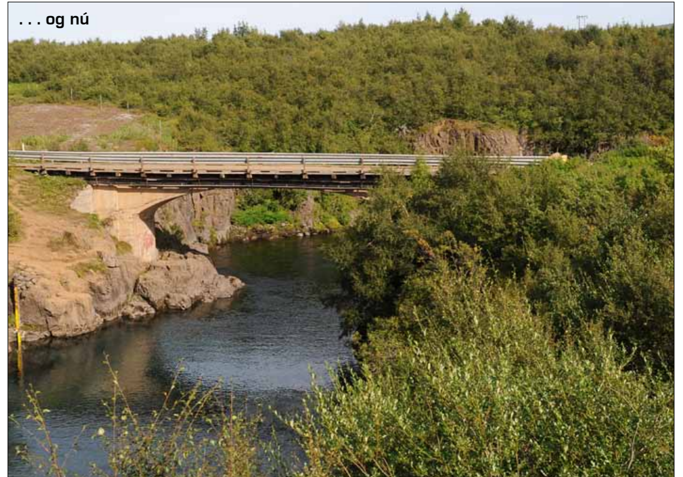
Brúin á Eyvindará var breikkuð 1955 og timburgólf sett á hana 1958. Þannig var hún í notkun til ársins 2001 en þá var ný brú byggð á Eyvindará aðeins neðar í ánni. Gamla brúin þjónar nú skemmtilegri gönguleið.