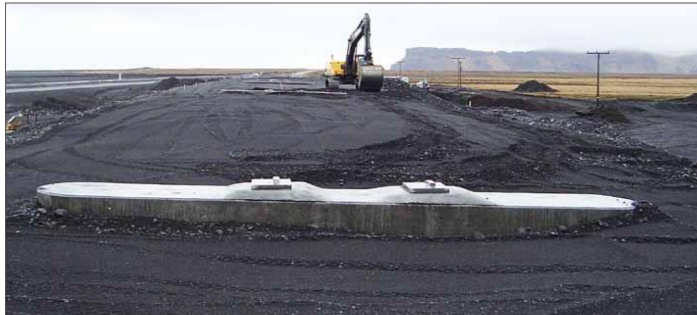
Stöplar nýrrar brúar yfir Múlakvísl bíða þess að hafist verði handa við gerð yfirbyggingar. Að verki loknu verður fyllingarefnið fjarlægt undan brúnni. Hjörleifshöfði í baksýn.

Engir samningar hafa verið undirritaðir frá því síðasta tölublað kom út