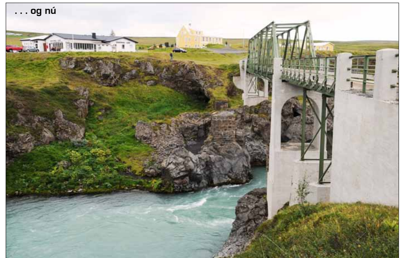
Skjálfandafljót hjá Fosshóli. Gamla myndin (GGZ) sýnir trébrúna frá árinu 1883 en er væntanlega tekin árið 1930 því undirbúningur er hafinn að byggingu brúar sem sjá má á nýju myndinni. Núverandi brú sem stendur aðeins norðar var tekin í notkun árið 1972 en gamla brúin er notuð sem göngubrú. Hún var gerð upp árin 1999 og 2000. Enn má sjá gömlu hlöðnu brúarstöplana.