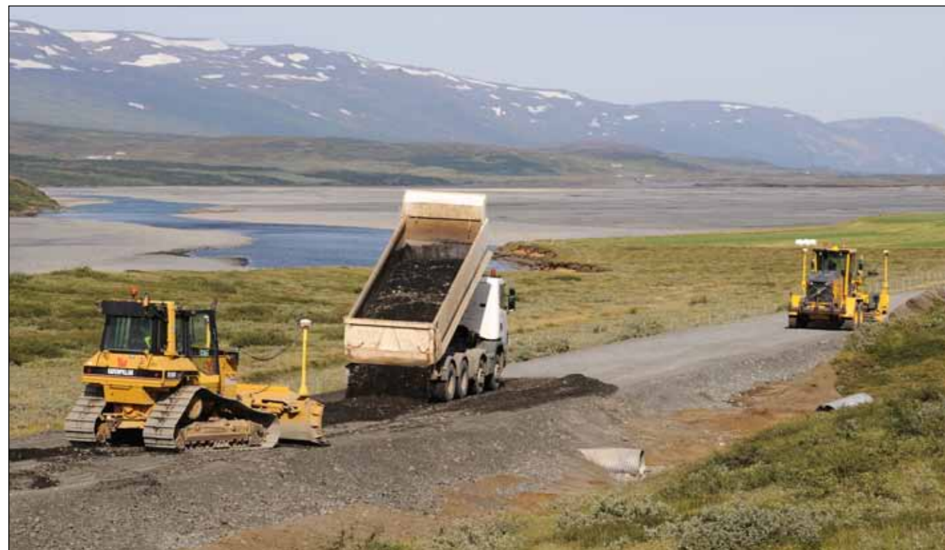
Hróarstunguvegur (925), endurbygging vegar og bundið slitlag 5,6 km. Verktaki: Ylur ehf. Jökulsá á Dal í baksýn. Myndin var tekin 29. ágúst 2013.