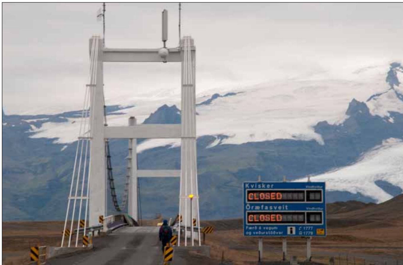
Til bráðabirgða verður nú birt enska orðið „CLOSED“ á ljósaupplýsingaskiltum Vegagerðarinnar í stað „ÓFÆRT“. Það verður reglan á meðan fundin er lausn á að koma upplýsingum til vegfarenda sem ekki skilja íslensku. Myndin er frá Jökulsárlóni og var breytt í tölvu.