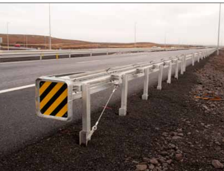
Réttur endafrágangur á vegrið við Reykjanesbraut. Vegrið fellur saman eins og harmonikka ef ekið er á það og stöðvar ökutækið um leið.

Í síðsta blaði birtist tilgáta um að maður nr. 37 væri Sigurður Sigfússon frá Vopnafirði. Prentvilla var í fæð- ingarári en réttur fæðingardagur er 29. september 1896.