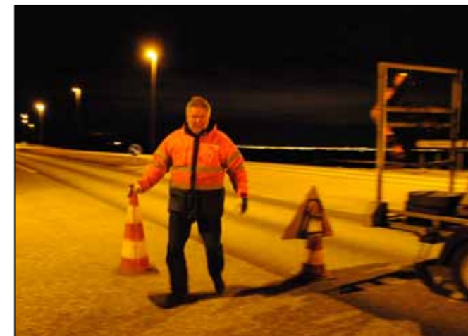
Nákvæmlega kl. 12 á miðnætti var Hringvegi lokað og umferð beint inn á Hvalfjarðarveg með stórum skiltavagni og keilum.