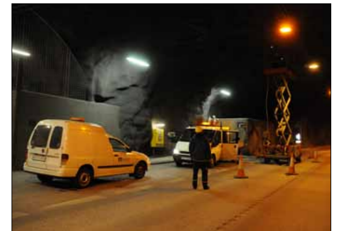
Uppsetning á nýjum ljósaskiltum.