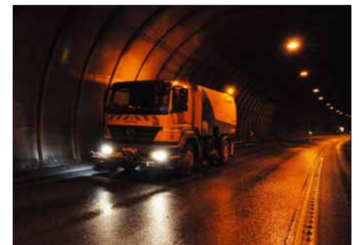
Öhreinindin sópuð upp eftir að veggirnir hafa verið spilaðir.