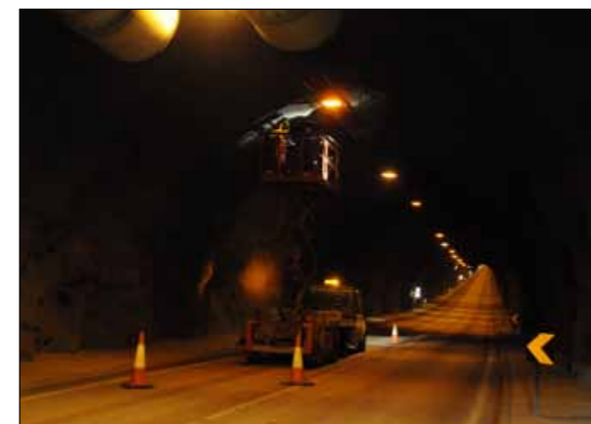
Svona vinna er ógerleg ef umferð er í göngunum.